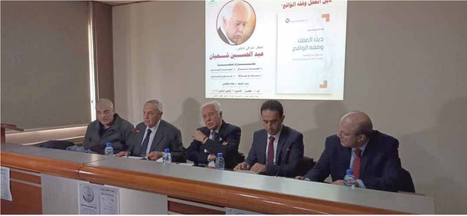
من خطاباته في سبيل ما تسعى إليه سورية لتنظيفها من قدرات الإرهاب.

ويضيف الدكتور بسام أبو عبد الله: إن ما جذبه للكتاب هو مقدمته، مركزاً على أهم القضايا التي تتاولها مستعرضاً ذلك في نقاط متعددة منها أن الكتاب ليس علمانياً وليس ضد المذنبين حيث إننا شعوب مؤمنة بطبيعية الأحوال ومن الممكن أن تختلف درجات الإيمان ولكن جميعاً محافظين وليس يبننا بلحدوث والكتاب لا يدعو للإلحاد، كما أشار إلى أنه لا بد من توافر قضايا ثلاث مهمة لمواكبة التطور الحاصل وهي المعرفة والمعلومة والحكمة، وأن الحوار من أهم ما تطرق الكتاب إليه فهو يكشف مكونات الإنسان، كما أنه من المميز أيضاً أن الكتاب عرض فكرة الإصلاح الجماعي حيث إن العمل الفردي لا يمكنه العودة بالمنفعة على جموع كبيرة حيث إنه لا تجديد من دون اجتهاد، كما أشار أيضاً بأن فكرة التدين ومظهره زادت ولكن التسويات وأخلاقيات الأفراد لم تتحسن، وأشار أبو عبد الله إلى أن أهم ما يتضمنه الكتاب هو ترسيخ تجديد الفكر الديني عبر استخدام الفعل والمنطق وهو الأمر الذي حدثنا عليه السيد الرئيس بشار الأسد في كثير من المناسبات.