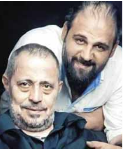
جورج وسوف وابنه وديع

لأنها كانت تستعد بظلالاً للحياة، مشيرة إلى أنها طلقت دليلاً من الله على إحساسه بها فكان الرد أنه استرد وديعته. وتابعت: «إن الله قد رحمها من معاناتها واختار لها سبيل الراحة من أي أوجاع والآلم مرت بها «خديجة»، ولو كانت عاشت كانت تفتت أكثر وربنا اختارها عنده عشان هي بتروح لأنني كنت متألم في كل مرة هشوها بتتوجع وتتالم خصوصاً أنها مكتشف حياة طبيعية».