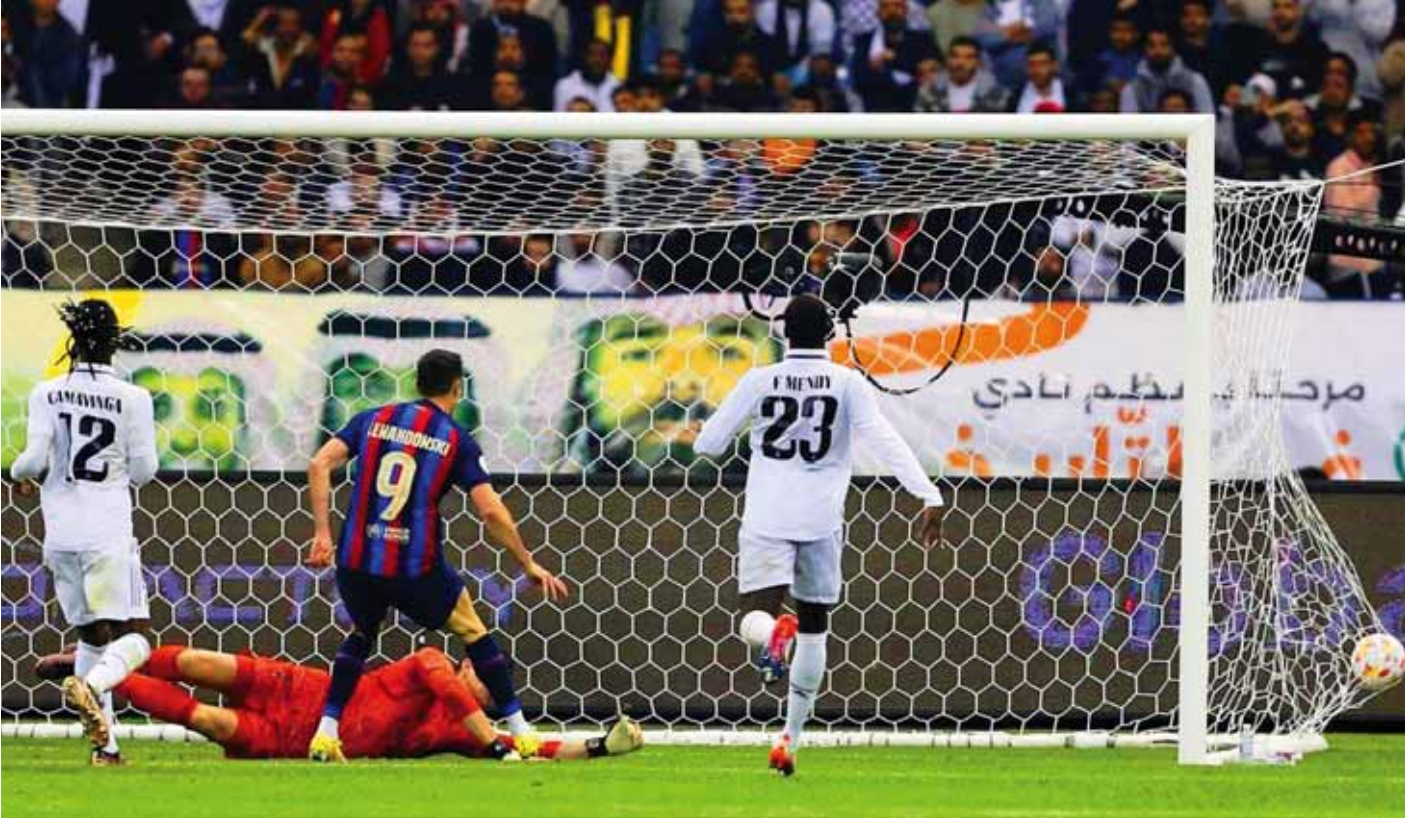
الكلاسيكو بولغراتي صوتاً وصورة

أسبوع حافل بالنتائج الكبيرة والغريبة والمفاجئة من حيث الأرقام، فشهد الدوري الإيطالي النتيجة الأعلى للموسم الحالي وصاحبها ثلاثا نابولي كان أحد المستفيدين من سقوط يوفنتوس أمام نابولي في قمة الجولة ١٨، وهذه النتيجة الكبيرة كانت مفاجئة رفقياً بديورها وخاصة إذا ما عرفنا أن فريق السيدة العجوز تلقى ٧ أهداف فقط في ١٧ جولة كاملة، ولم يكن أكد عزمه على الخسني قدماً في الصدارة حتى إشعار آخر، فقد فاز إنتر واقترب ووجد ميلان لم يستقد كما ينبغي فسطح بفتح تعادل على أرض ليشي. وتوج برشلونه بطلاً لكأس السوبر الإسبانية بفوزه على غريمه الأبدى ريال مدريد بثلاثة أهداف لهدف في النهائي الذي أقيم في الرياض بلطف المدرب تشافي هيرنانديز بلقبه الأول مع الكاتالوني الذي عزز زعامته للمسابقة. وفي الليغا ووسط انشغال القطبين بنهائي كأس السوبر ومعهما بيتيس استغل سوسيداد الأمر جيداً وقلص الفارق مع المنصرد وصيفه بفوزه على جاره بلباو في ديربي الباسك على حين تعثر أتلنتكو بالتعادل على أرض الخيريا وواصل إسبيلية تزييف النقاط بخسارة جديدة ليبقى ضمن مثلث الهبوط، وفي الليغ آن سجل موناكو نتيجة قياسية بفوزه على أجاكسيو بنتيجة ١/٧ معادلاً نتيجة سابقة للباريسي التي سقط على أرض رين في قمة الجولة الأخيرة ذهاباً ليتقلص الفارق مع أقرب منافسيه إلى ثلاث نقاط لا أكثر لتنتعش آمال لنس ومرسيليا.