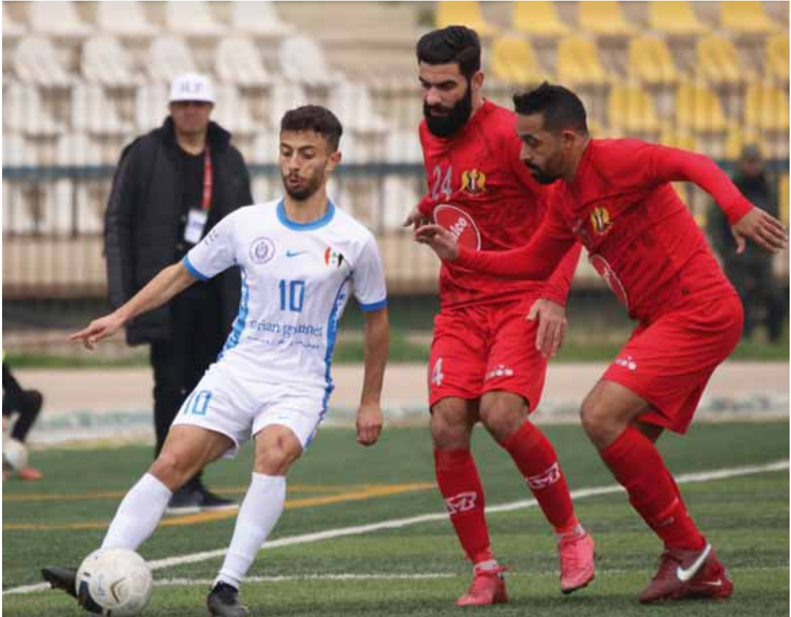
من فوز الجيش على حطين