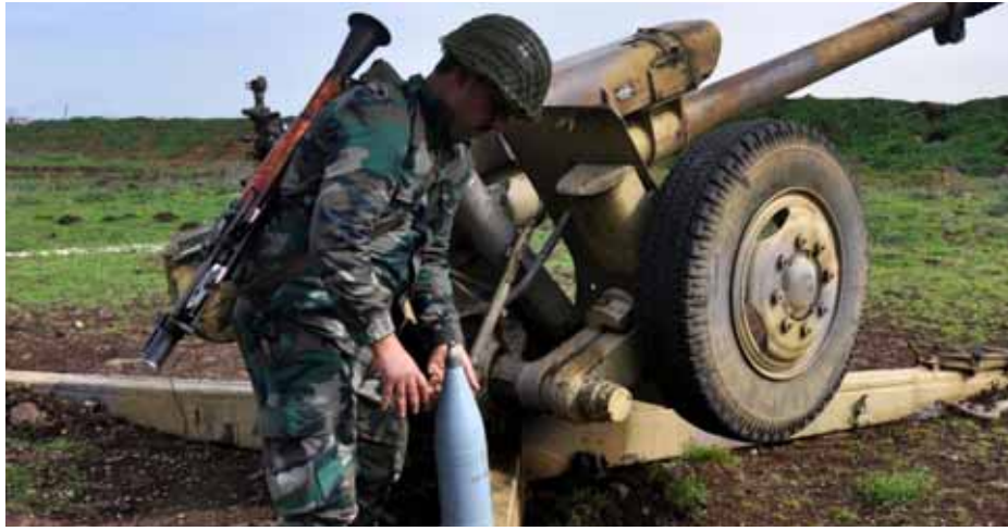
قوات للجيش العربي السوري في ريف إدلب الجنوبي

في الأثناء، قالت مصادر متابعة لتطور خطوات تقارب إدارة أردوغان من القيادة السورية لـ«الوطن»: إن مدار استدارة الأولى نحو الثانية رهن بموقف إدارة الرئيس الأميركي جو بايدن من عملية الانفتاح ورد أنقرة عليها، ولذلك اكتسب أهمية كبيرة زيارة جاويش أوغلو إلى واشنطن لحضور اجتماع «المجلس الاستراتيجي للعلاقات» بين تركيا والولايات المتحدة المقرر اليوم ثم لقاءه مع نظيره الأميركي أنتوني بلينكن غداً. وأوضحت المصادر، أن مصلحة إدارة أردوغان مرتبطة بتنفيذ المزيد من خطوات التقارب مع القيادة السورية، حتى إن كانت الغاية التركية من التقارب تحقيق أهداف انتخابية ضاغطة على مفصل حزب «العدالة والتنمية» الحاكم، على اعتبار أن مكافحة الإرهاب عند الحدود التركية الجنوبية وإعادة اللاجئين السوريين إلى بلادهم، أهم ملفين انتخابيين مطروحين على طاولة الحوار بين البلدين ويتنظران تعاون دمشق في حلها.