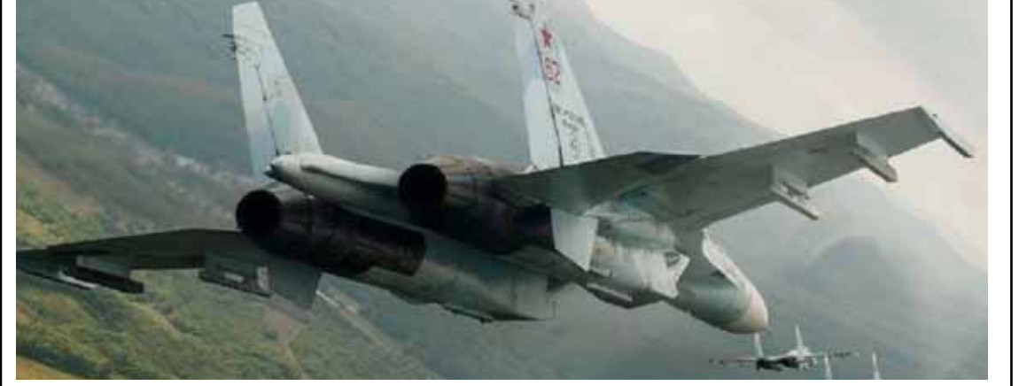
طائرة «سوخوي 27» حلقت فوق منطقة بحر البلطيق للتصدي لطائرة ألمانية عسكرية اقتربت من الحدود الروسية

وأوضحت الوزارة أنه «بعد أن ابتعدت الطائرة العسكرية الأجنبية عن حدود دولة روسيا الاتحادية الجوية، عادت المقاتلة الروسية إلى قواعدها. هذا التطور تزامن مع إعلان موسكو أمس أن دبابات «تشانجر 2» البريطانية التي ستحترق لندن إرسالها لكيف، ستحترق مثل العربات والدبابات المرسلات سابقاً إلى أوكرانيا.