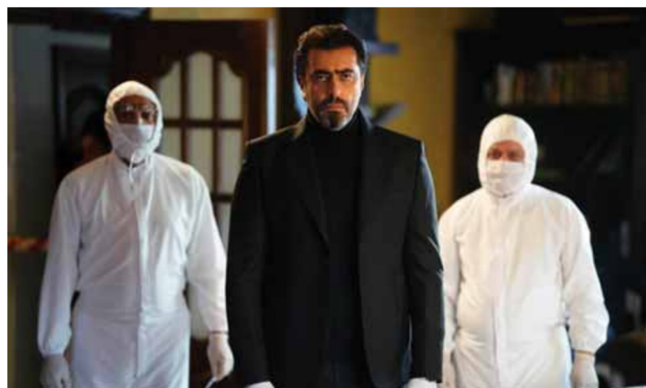
من مسلسل خريف عمر

ومن خلال الدراما التلفزيونية يمكن معالجة العديد من القضايا على الصعيد الاجتماعي والثقافي والسياسي والديني، كما يمكن إيصال العديد من الرسائل إلى المتلقي بهدف زيادة الوعي لديه. الدراما الاجتماعية أيضاً أحد العناصر التي تتحكم في وعي الناس وتجسد واقع الحياة والصراع بين الخير والشر، وقد تطرح حلولاً أو تعالج مشكلة أو عادة مجتمعية سيئة في المجتمع، بالتالي يكون لها أثر وأهمية في المجتمع، كما تعد قوة ثقافية مؤثرة في المجتمع لا يستهان بها، وذلك بسبب انتشارها الواسع وقدرتها على تخطي الحواجز والوصول إلى أكبر عدد من الأشخاص. وأهم ما يميز مسلسلات هذا العام هو التنوع بالقصص والقضايا والحكايا المطروحة، مع حضور بارز للتشويق والأكشن والإثارة، وإلى التفاصيل: