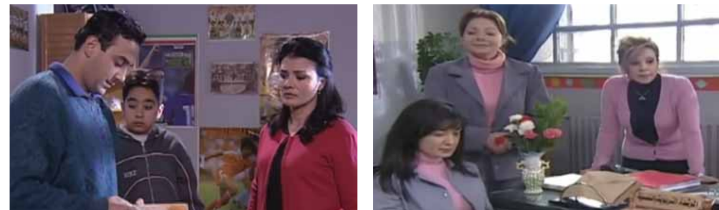
من مسلسل «أحلام كبيرة»

عند الحديث عن الأم لا بد لنا من ذكر الفنانة الكبيرة منى أوصف التي برعت في تأدية أدوار الأم عبر سلسلة أعمال عالية في الأذهان، بدءاً بنهاية رجل شجاع ومروراً