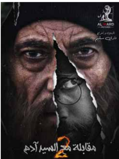
من مسلسل «مقابلة مع السيد آدم»