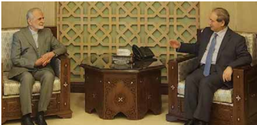
وزير الخارجية والمغتربين فيصل المقداد خلال لقائه رئيس مجلس العلاقات الخارجية الإيراني