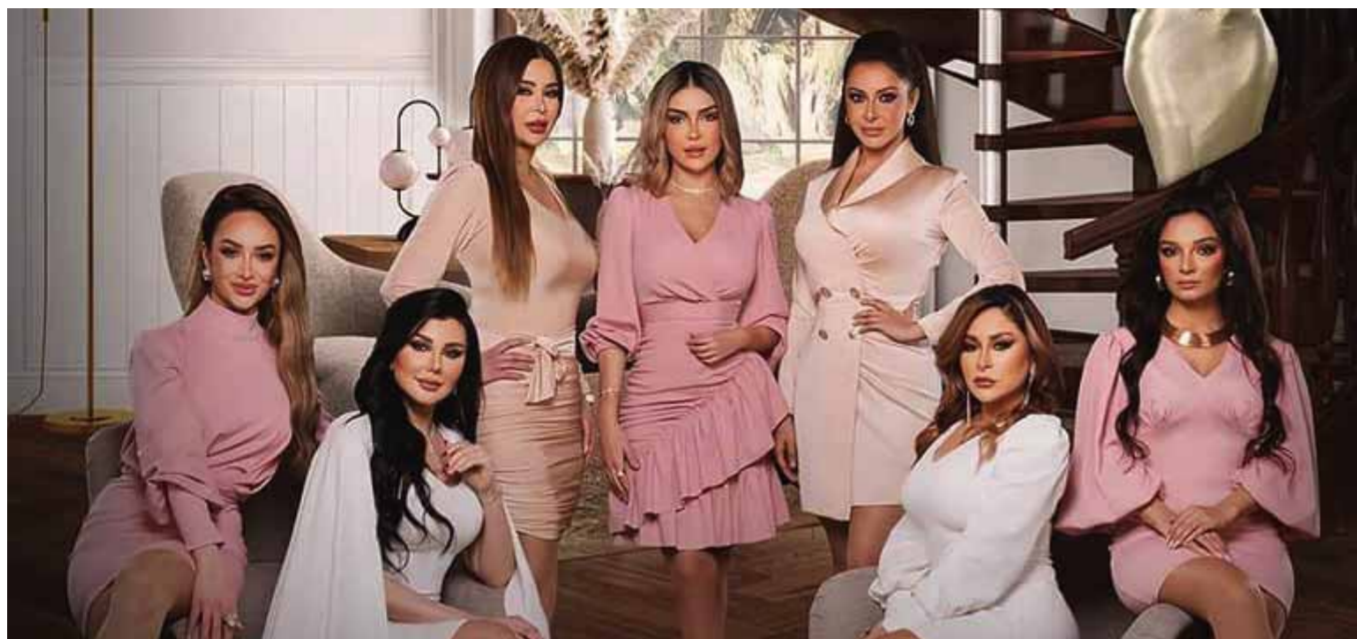
من مسلسل «صبايا فيلبيس»