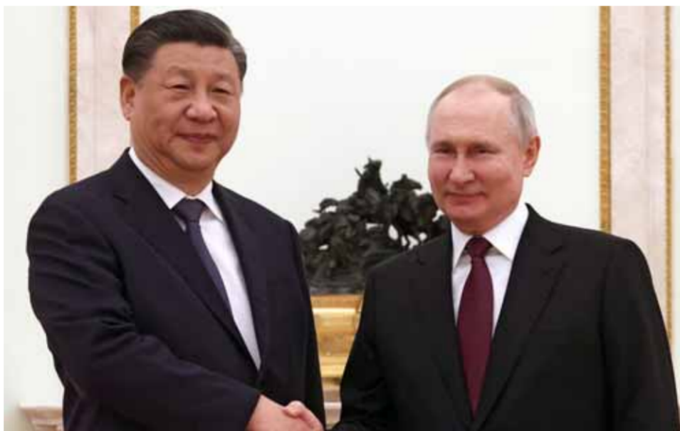
من لقاء الرئيسين الروسي فلاديمير بوتين و الصيني شي جين بينغ

في زيارة وصفت بالترخيصة، وللتأكيد على تجدد العلاقات وإستراتيجية التعاون في مختلف المجالات، وصل الرئيس الصيني شي جين بينغ إلى العاصمة الروسية موسكو مفتتحاً مرحلة جديدة في مسيرة العلاقات بين البلدين. زيارة الرئيس شي إلى روسيا حضر فيها إضافة إلى ملف العلاقات بين الجانبين، التطورات في المنطقة بما فيها ملف أوكرانيا الساخن ومبادرة الصين للتوصل إلى حل للأزمة الأوكرانية، والتي قابلتها موسكو بافتتاح عبرت عنه تصريحات الرئيس الروسي فلاديمير بوتين خلال لقائه نظيره الصيني. وعقد الرئيسان شي وبوتين أمس، مباحثات في الكرملين بعد ساعات من وصول الرئيس الصيني إلى موسكو، أكد خلالها بوتين أن الصين حققت خلال السنوات الأخيرة، قفزة هائلة في التنمية، وهذا أمر له اهتمام حقيقي في جميع الأنحاء، وأضاف بوتين: «تم اتخاذ خطوات مهمة في تطوير العلاقات بين روسيا والصين على مدى السنوات العشر الماضية، حيث تصافح حجم التجارة بين البلدين، وبلغ الآن ١٨٥ مليار دولار».