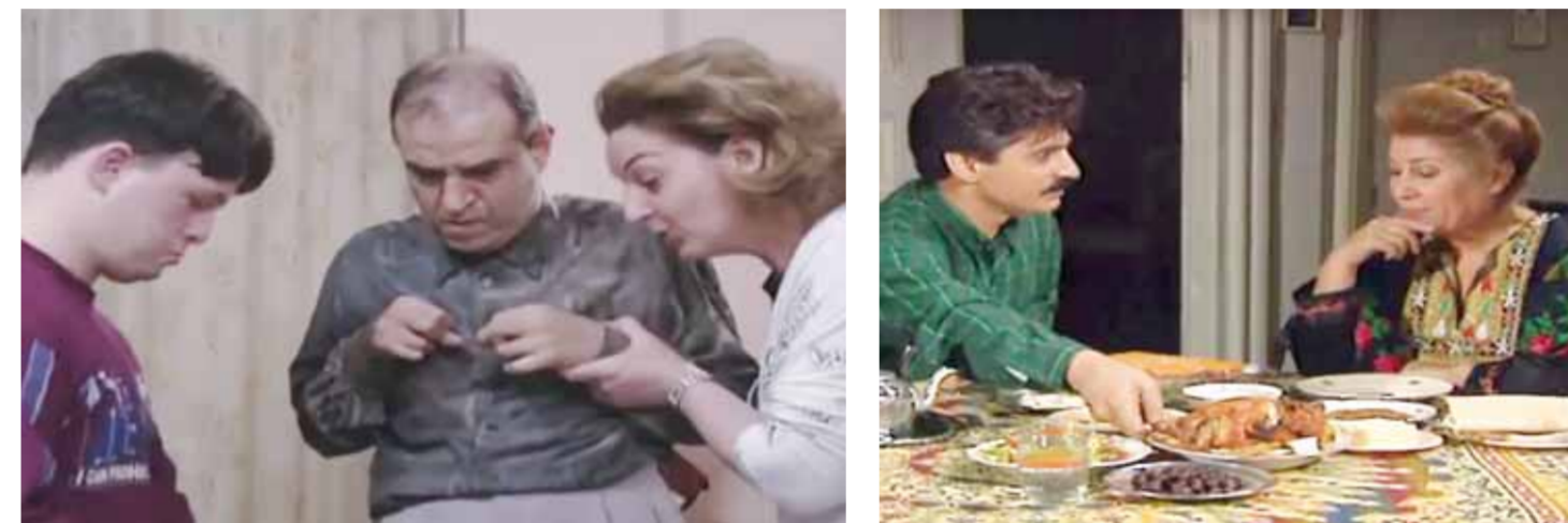
من مسلسل «وراء الشمس»