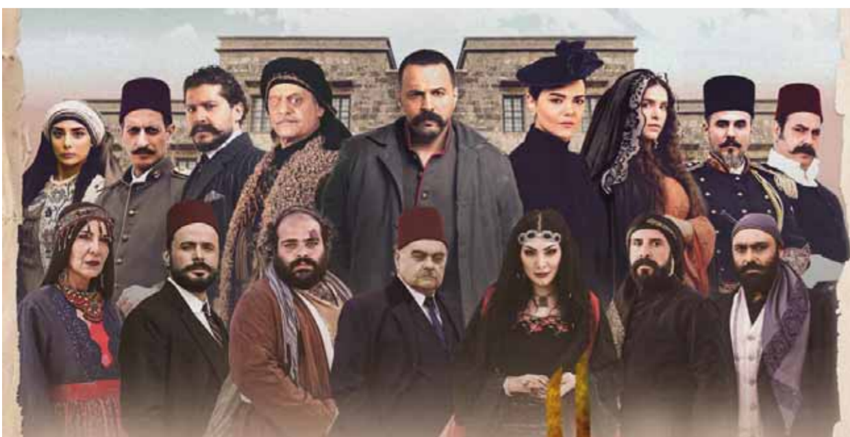
من مسلسل «الزئد ذئب العاصي»