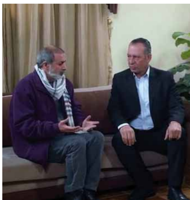
من مسلسل «ألم مستمر»