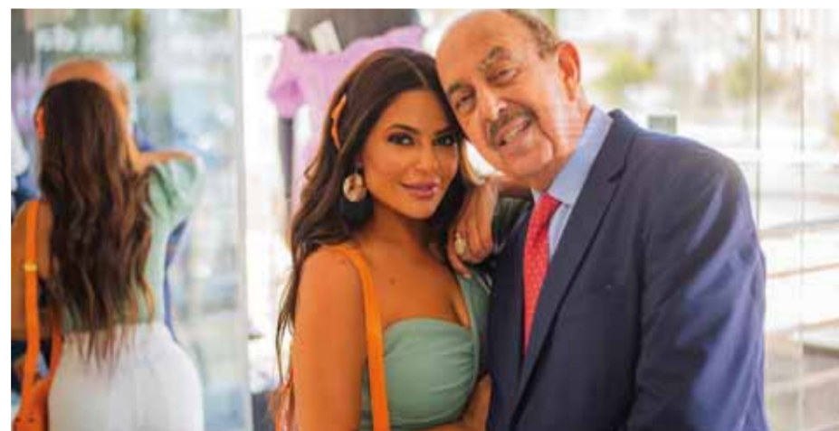
من مسلسل «الكرزون»