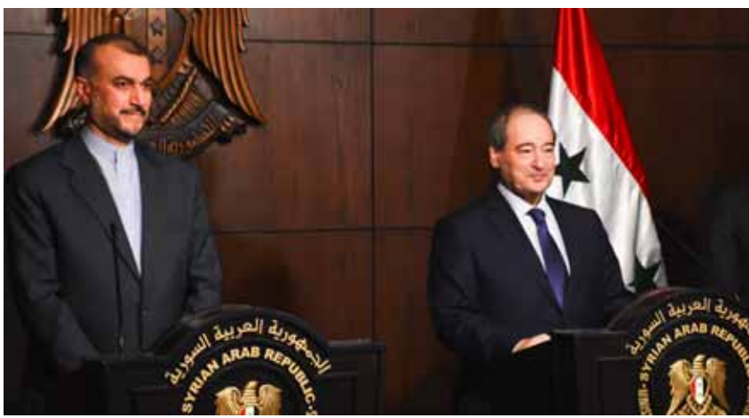
مؤتمر صحفي لوزيري الخارجية والمغتربين فيصل المقداد ونظيره الإيراني حسين أمير عبد الهيمان

بضرورة انسحاب القوات التركية من أراضيها ووقف دعم التنظيمات المسلحة مازالت على طاولة البحث، حيث إن هذه الغوايت ستشكل بالضرورة الأرضية التي ستستلحق منها أي مباحثات سياسية تجمع سورية وتركيا على طاولة واحدة. وقبل أيام نقلت وكالة «نوفوستي» عن نائب وزير الخارجية الروسي ميخائيل بوغدانوف قوله: «إن المشاورات الرباعية على مستوى نواب وزراء الخارجية، هدفها إعداد اجتماع لوزراء الخارجية»، وأضاف: «انطلاقاً من حقيقة أنه كلما حدث ذلك بشكل أسرع كلما كان ذلك أفضل، ولكن بالمقابل هناك جدول عمل لزملائنا السوريين، والأتراك، والإيرانيين، في حين لا توجد تواريخ محددة، ونواصل التنسيق».