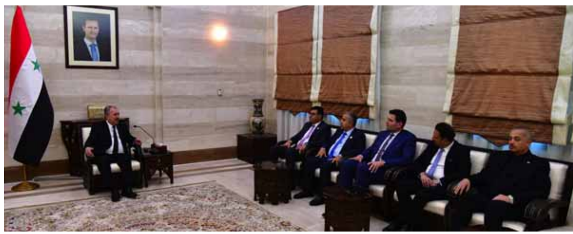
رئيس مجلس الوزراء حسين عرنوس خلال لقائه وزراء الزراعة في الأردن والعراق ولبنان (عن الانترنت)

شراكة حقيقية عربية- عربية في علاقاتها البيئية الكاملة سواء لجهة الترانزيت بين الدول الأربع وبوابتنا إلى العالم العربي هي سورية، ونحن اليوم لا نتحدث فقط عن السياسة بل عن الاقتصاد، فالتعاون الاقتصادي مع سورية هو مصلحة لبنانية بحته وبالتالي نحن نحتاج صفر مشكلات مع دول المنطقة لأن عدونا واحد هو إسرائيل. بدوره أكد وزير الزراعة العراقي عباس جبر العلياني في تصريح لـ«الوطن»، أن العالم اليوم يعيش ظروفاً اقتصادية صعبة نتيجة ما مر من ظروف تتلخص بالتغيرات المناخية التي انعكست على كل دول العالم إضافة إلى الحروب التي حصلت بالمنطقة، وكل هذه الظروف تستدعي من هذه الدول أن تقف لمواجهة هذه التغيرات.