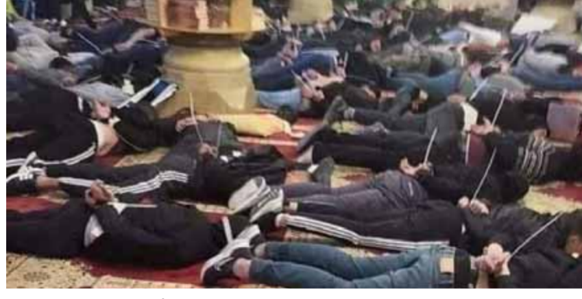
قوات الاحتلال الإسرائيلي تعتقل العشرات من المعتكفين داخل المسجد الأقصى

أحدث فصائل المقاومة الفلسطينية أن الاعتداء المتواصل على الأقصى واقحامات الصهابة والتهمج على المرابطين هو عدوان صهيوي خطير يستوجب هبة شعبية وفضائية شاملة لإشغال الأرض نأراً ولهبياً. بيان فصائل المقاومة جاء رداً على اعتداءات قوات الاحتلال على المعتكفين الفلسطينيين في المسجد الأقصى، حيث أصيب العشرات من جراء ذلك، واقتمحت قوات الاحتلال بأعداد كبيرة المسجد الأقصى واعتلت سطح المصلى القبلي، وكسرت عدداً من نوافذه وقطعت التيار الكهربائي عنه وأطلقت الرصاص وقنابل الصوت والغاز السام على المعتكفين فيه لإجبارهم على الخروج منه، ما أدى إلى إصابة أكثر من ٢٠٠ فلسطيني بجروح وكسور وحالات اختناق، كما قامت باعتقال أكثر من ٥٠٠ آخرين بينهم مصابون، على حين تسببت قنابل الغاز التي أطلقتها باشتعال النيران في جزء من المصلى وتمكن الفلسطينيون من إطفائها. واستمر الاقتحام لساعات أجبرت خلالها قوات الاحتلال المعتكفين على الخروج من المسجد لتأمين اقتحامات المستوطنين لباحاته التي بدأت باستباحتها في الساعة السابعة صباحاً عبر مجموعات تتكون كل واحدة منها من ٥٠ مستوطناً. وترافق عدوان قوات الاحتلال الوحشي على المعتكفين في الأقصى مع اعتداءات لا تقل دموية على الفلسطينيين في محيط المسجد ومنطقة باب العمود والبلدة القديمة من القدس لمنعهم من الوصول إلى المسجد ونصرة المعتكفين فيه، الأمر الذي أدى إلى إصابة عدد منهم، ورداً على هذه الاعتداءات الإسرائيلية، أطلقت المقاومة رشقات صاروخية من