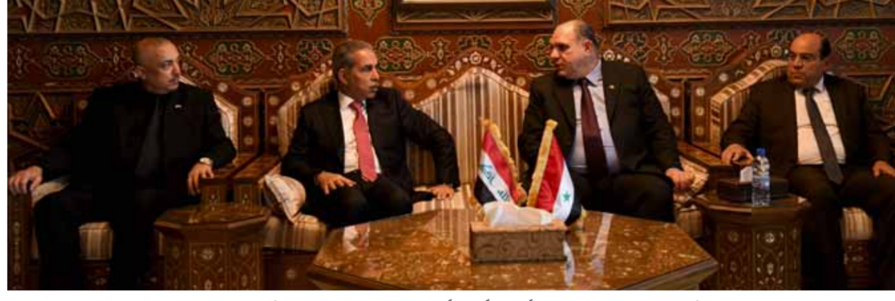
وزير العدل القاضي أحمد السيد خلال استقباله وفداً قضائياً عراقياً برئاسة رئيس مجلس القضاء الأعلى القاضي فائق زيدان (سانا)

رئيس محكمة استئناف الرصافة القاضي عماد خضير محمد الجابري، ورئيس محكمة استئناف الكرخ القاضي خالد طه المشهدي، ومدبر عام دائرة الحراسات القضائية راجح عبد حسن. وفي وقت لاحق أمس، اتفق السيد ورئيس مجلس القضاء الأعلى العراقي على دراسة مشروع اتفاقية قضائية للتعاون القضائي بين البلدين. جاء ذلك خلال الزيارة التي قام بها زيدان والوفد العراقي المرافق لوزارة العدل، وذكر المرکز الإعلامي لمجلس القضاء العراقي في بيان له، أن «زيدان أجرى مباحثات مع السيد ورئيس أعضاء محكمة النقض السورية ورئيس النقض القضائي والنائب العام، حيث تم الاتفاق على دراسة مشروع اتفاقية قضائية للتعاون القضائي بين البلدين الشقيقين». إمكانية عقد اتفاقية قضائية جديدة بين البلدين، لافتاً إلى أن «اتفاقية الرياض العربية، الموقعة عام ١٩٨٣، والتي تربط التعاون القضائي بين الدول العربية تحتاج إلى تحديث، وهذا التحديث يمكن أن يتم عبر الاتفاقيات الثنائية. بحسب مشروع اتفاقية جديدة لتعزيز هذا التعاون، إطار ترسيخ وتعزيز التعاون القضائي والقانوني بين سورية والعراق، مؤكداً أنه سيتم من خلالها وضع مشروع اتفاقية جديدة لتعزيز هذا التعاون، مبيناً أن «اتفاقية الرياض العربية» يتم تطبيقها بشكل جيد بين البلدين في مجال تسليم المجرمين، وغيرها من القضايا. ويضم الوفد العراقي رئيس هيئة الادعاء العام القاضي نجم عبد الله الأحمد، ورئيس هيئة الإشراف القضائي القاضي ليث جبر حمزة،