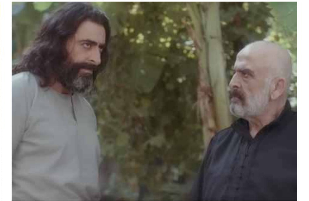
من مسلسل «العربي»