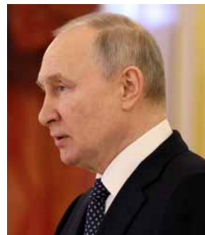
الرئيس الروسي فلاديمير بوتين خلال تقبله أمس أوراق اعتماد ١٧ سفيراً من بينهم سفير سورية بشار الجعفري