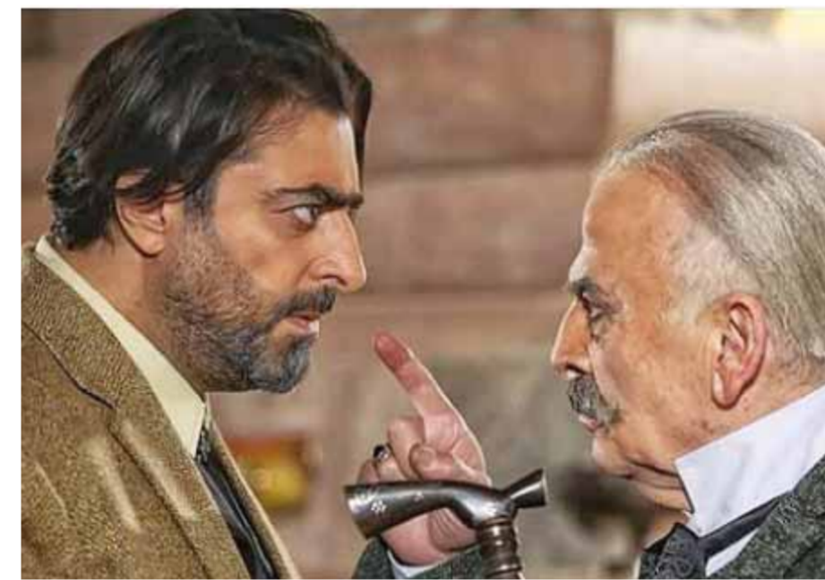
من مسلسل «خريف عمر»