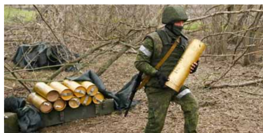
قوات المدفعية الروسية تستعد لتصف القوات الأوكرانية في أفدييفكا

ولا يحق لأحد الإدلاء بتصريحات غير مسؤولة بهذا الصدد. ودعا وانغ اليابان إلى تصحيح ممارساتها الخاطئة المتصلة في تصعيد التوترات الإقليمية والتوقف عن الاستفزاز وخلق المواجهات بين التكتلات وانتاع سياسة بناءة عوضاً عن ذلك لبناء علاقة مستقرة مع الصين. وفي وقت سابق، أصدرت وزارة الخارجية اليابانية بيانها السنوي المعروف باسم «الكتاب الأزرق»، وجاء فيه أن الإجراءات المشتركة للقوات المسلحة الصينية والروسية بالقرب من الحدود اليابانية تشكل مصدر قلق لآمن اليابان.