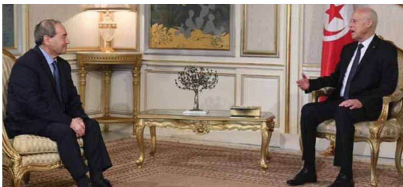
الرئيس التونسي يستقبل وزير الخارجية والمغتربين فيصل المقداد

لقاءً ثنائياً بمقر وزارة الشؤون الخارجية والهجرة والتونسين بالخارج، تلته جلسة مباحثات موسعة بين وفدي البلدين، تم خلالها الترحيب بعودة العلاقات التونسية - السورية إلى مسارها الطبيعي ويتعين سفير للجمهورية التونسية لدى الجمهورية العربية السورية، وبإعادة فتح السفارة السورية بتونس وتعيين سفير على رأسها. وفي ختام اللقاء صدر بيان مشترك تم الاتفاق من خلاله على تكثيف التواصل بين البلدين في المرحلة المقبلة بهدف تعزيز التشاور والتنسيق حول مختلف القضايا والمسائل الثنائية ذات الاهتمام المشترك والعمل على عقد اللجنة المشتركة، والعمل على استئناف التعاون الاقتصادي بين البلدين ولاسيما في المجالات ذات الأولوية. وشدد على تعزيز التعاون في المجال القنصلي والإنساني، والعمل على عقد اللجنة القنصلية المشتركة في أقرب الأجل الممكنة، وتعزيز التعاون في المجال الأمني ولاسيما في مجال مكافحة الإرهاب والجريمة المنظمة وشبكات الاتجار بالبشر.