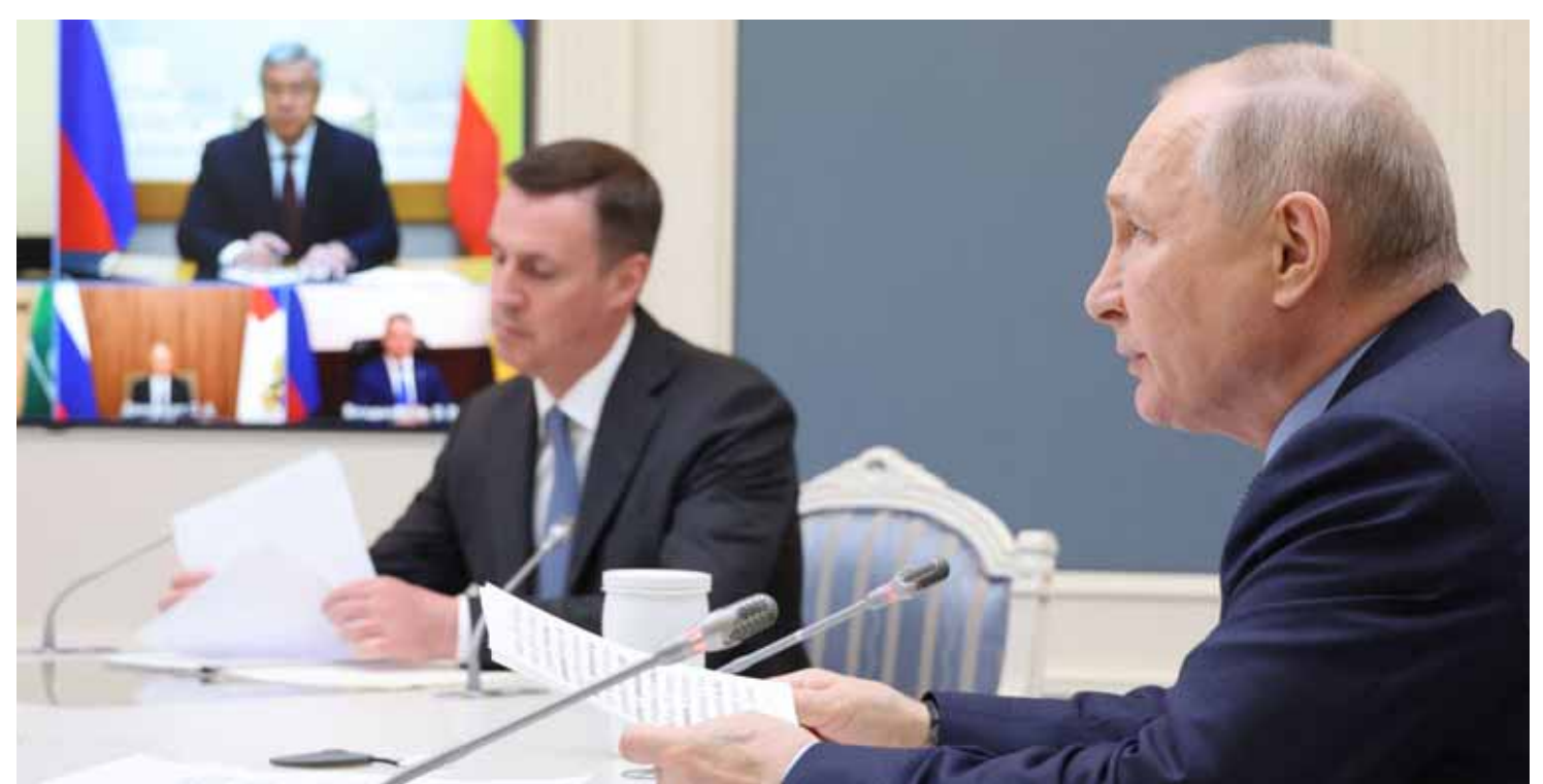
الرئيس الروسي فلاديمير بوتين يترأس اجتماعاً حول العمل الزراعي الربيعي مع مؤتمر بالفيديو في الكرملين

السبع بهيروشيما اليابانية هو أمر مثير للسخرية. وتلقت وكالة «نوفوستي» عن زاخاروف: أن هذا الموضوع «التهديد النووي الروسي المزعوم الذي تم الإعلان عنه في قمة مجموعة السبع في هيرونيمو هو مزيج مذل من السخرية اللا محسوبة والمزيجين والعنفية المحزنة للعباية لقرار التخلي عن اليابانية».