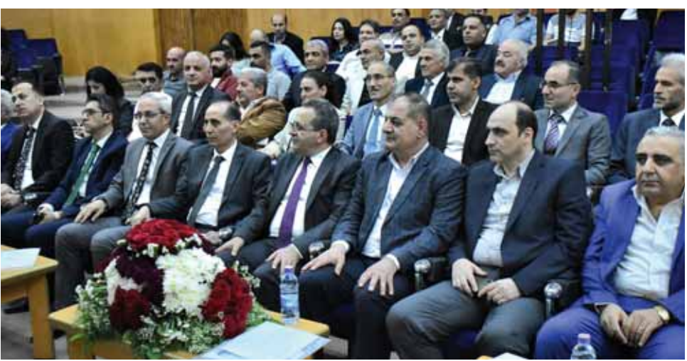
جنار العلي أكد وزير النفط والثروة المعدنية

أكد وزير النفط والثروة المعدنية السورية محمد حسن قنطا خلال لقائه أمس بالقائمين على منشأة دواجن اللاذقية مناقشة واقع عمل قطاع الدواجن والمشكلات والصعوبات التي تواجه عمل مثل هذه المنشآت والحالة الفنية والإنتاجية لها، وتقديم مقترحات لتطوير عملها؛ إنه لا يمكن تجاهل أهمية قطاع الدواجن في توفير بروتين حيواني عالي الجودة، وهو من المنتجات الأساسية في النظام الغذائي للإنسان، كما أن قطاع الدواجن يساهم في توفير فرص عمل للشباب، خاصة في المناطق الريفية.