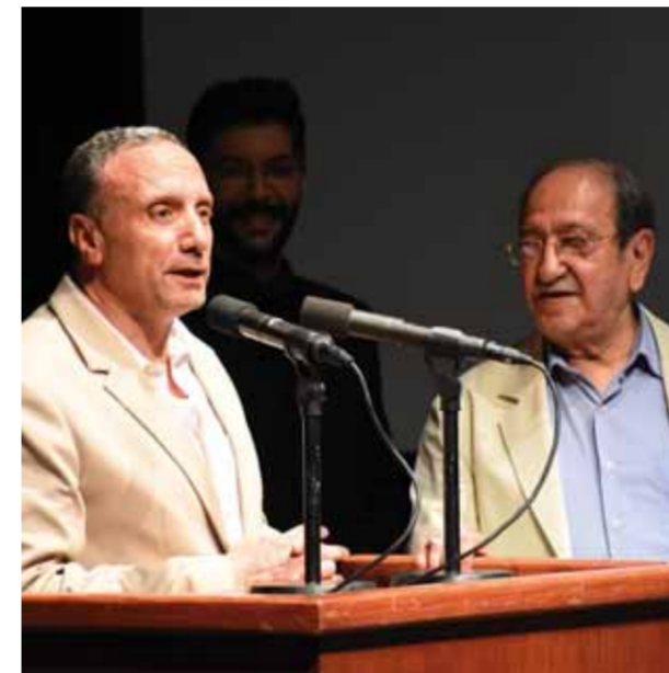
النجم الكبير دريد لحام إلى جانب المخرج باسل الخطيب

منارة فكر تعبر عن تاريخ وعراقة هذه الأمة العظيمة. وفي حديثه عن النجم دريد لحام قال: أعطت إسهاماته الأخيرة في أفلام المؤسسة طعماً خاصاً بقيمة مضافة استثنائية لهذه الأفلام، فشاركنا لأن مؤسستنا تكبر وبوقوه معنا ونفتخر بوجود اسمه في إنتاجها.