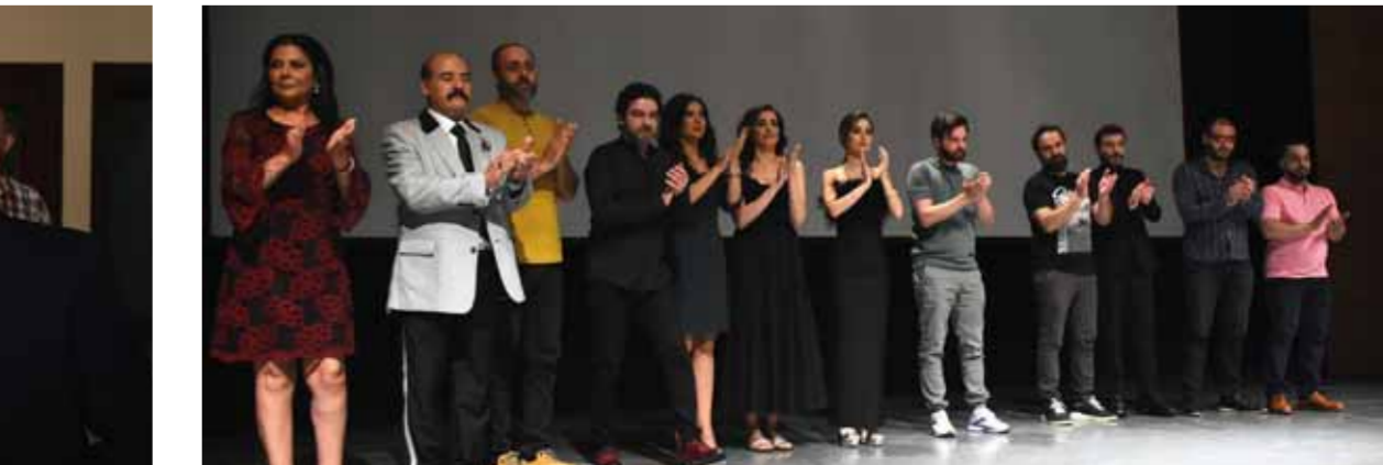
الممثلون المشاركون في الفيلم

ويركز على حالة التردي الاجتماعي التي خلفتها الحرب وانعكاساتها على سلوك الناس ومضائهم وأخلاقهم، من خلال مواجهة الحكيم أزمة شخصية أثناء زيارة حبيبته له، ليضع الفيلم المثلقي أمام حالة إن كان سبواجه أزمتة وحيداً أم لا بعد كل ما قدمه لأهل البلدة.