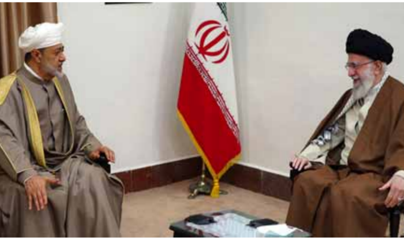
المرشد الأعلى في إيران علي خامنئي خلال لقائه سلطان عمان مهيب بن طارق آل سعيد

أعلنت إيران وسلطنة عُمان الاتفاق على تنظيم وثيقة تعاون إستراتيجية بين البلدين في مختلف المجالات، وأكدت على دور القطاع الخاص في تعزيز أفق التعاون الاقتصادي وزيادة التبادل التجاري بينهما، كما رحبتا بتوطيد ثقافة الحوار في المنطقة لتسوية الأزمات والقضايا العالقة. وفي بيان إيراني - عماني مشترك صدر أمس في ختام زيارة السلطان مهيب بن طارق آل سعيد إلى طهران، أعرب الجانبان عن ارتياحهما للمستوى «الراقي» للعلاقات الثنائية بين البلدين، مشيرين إلى نموها المتزايد وخاصة بعد الزيارة الأخيرة للرئيس الإيراني إبراهيم رئيسي التي تمت بدعوة من السلطان مهيب العام الماضي. وعبر الجانبان عن حرصهما على توسيع متزايد للعلاقات في المستقبل، ودعمهما اللجان المشتركة وفرق العمل، وتبادل الزيارات في المجالات المتنوعة لتتبع تنمية العلاقات. وفي إطار تمتين العلاقات بين البلدين، ووضع أسس للمحافظة على ديمومتها، وجهت قيادات البلدين حكومتها للعمل على التوصل إلى وثيقة التعاون الإستراتيجي بين البلدين والتوقيع عليها في مختلف المجالات التي تعزز التعاون المشترك والمنافع المتبادلة. ووفق البيان، تبادل سلطان عُمان والرئيس الإيراني أراءهما بشأن عدد من القضايا الإقليمية والدولية ذات الاهتمام المشترك، وأخذاً على أهمية مواصلة الجهود والمساعى الحميدة في المجالات الأمنية والنسائية والاقتصادية والثقافية المختلفة لترسيخ قواعد السلام والاستقرار في المنطقة، ورحباً بتواصل المحادثات والمشاورات السياسية بين البلدين.