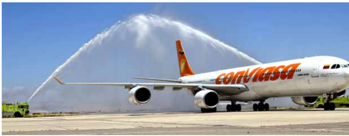
أول طائرة مباشرة من فنزويلا إلى سورية تصل مطار دمشق الدولي بعد توقف نحو ١١ عاماً

كلا البلدين بأمس الحاجة إلى تعزيز العلاقات الاقتصادية، وتنشيط السياحة، وتقديم التسهيلات للمواطنين الفنزويليين من أصل