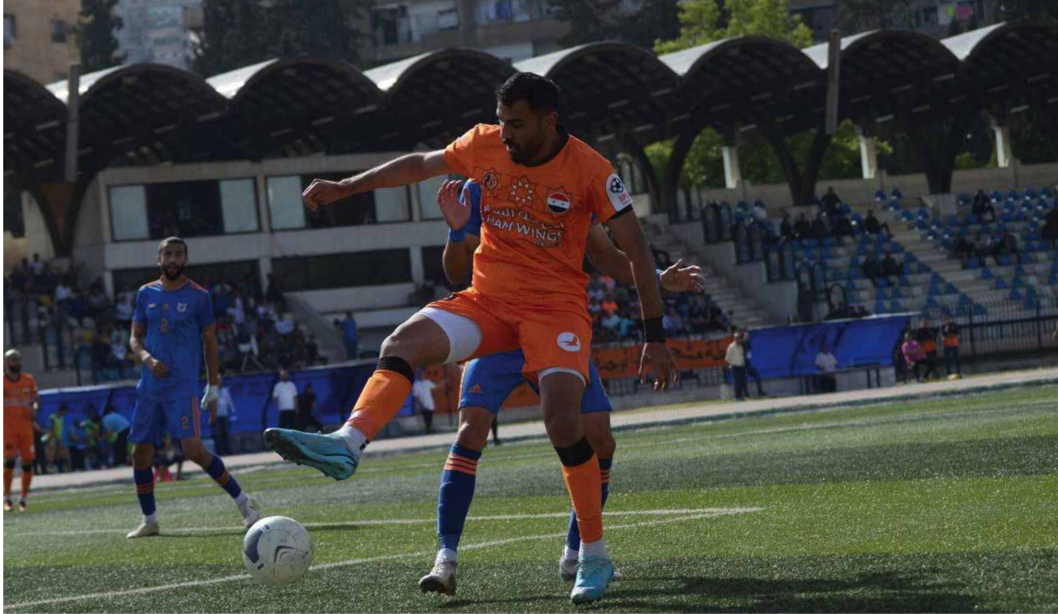
من تعادل الوحدة والكرامة

الإذارات: من الطليعة خالد الدينار، ولا أحد من الفتوة، وبلا أي طرد.