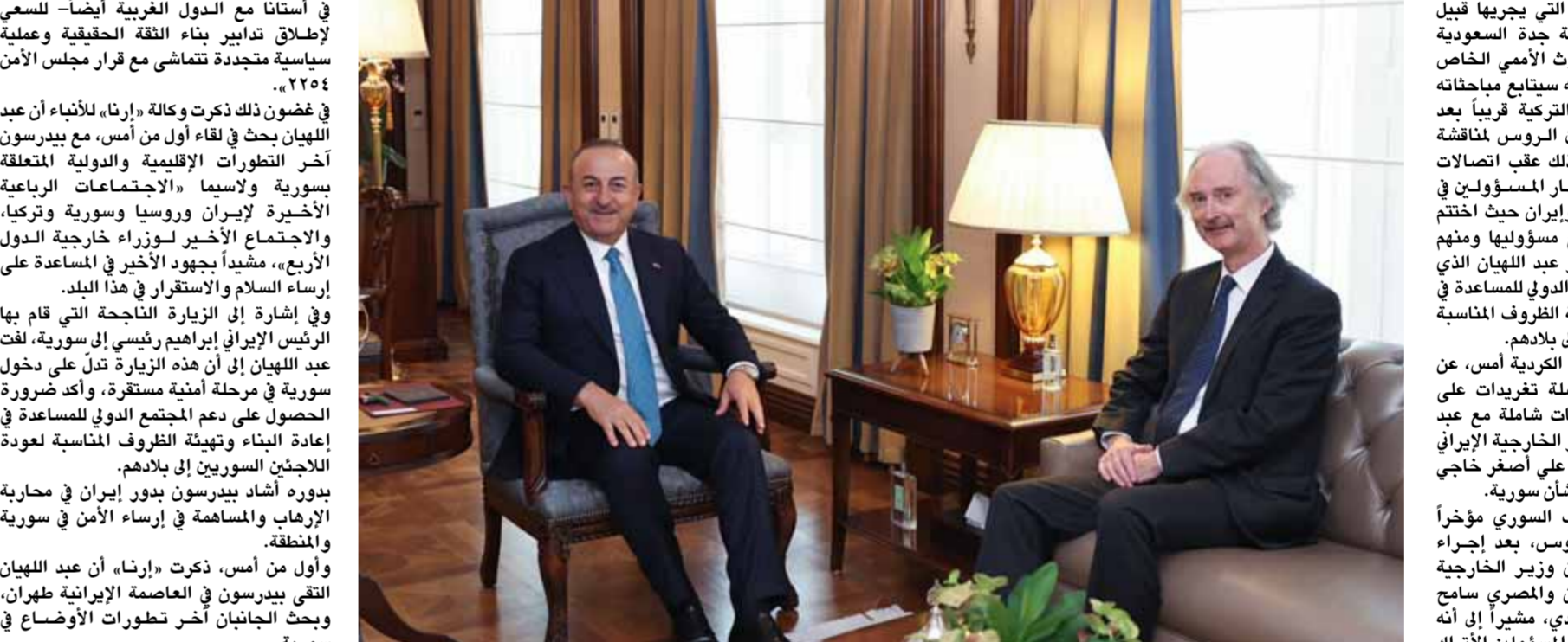
في إطار مشاوراته المكثفة التي يجريها قنصل دمشق في جنيف مع كبار المسؤولين الإقليميين في سوريا، تحدثت وكيلة «مستقيم» الإيرانية عن أن مصر، وبحثت معها في هذا الملف، وإشارة إلى الأزمات التي يشهدها اليمن، حيث ناقشوا أيضاً مع مسؤولي وزارة الخارجية السعودي فضلاً عن ممثلين من منظمة العفو الدولية، وبنسب المجتمع العالمي، حيث ناقشوا أيضاً مع مسؤولي وزارة الخارجية السورية.