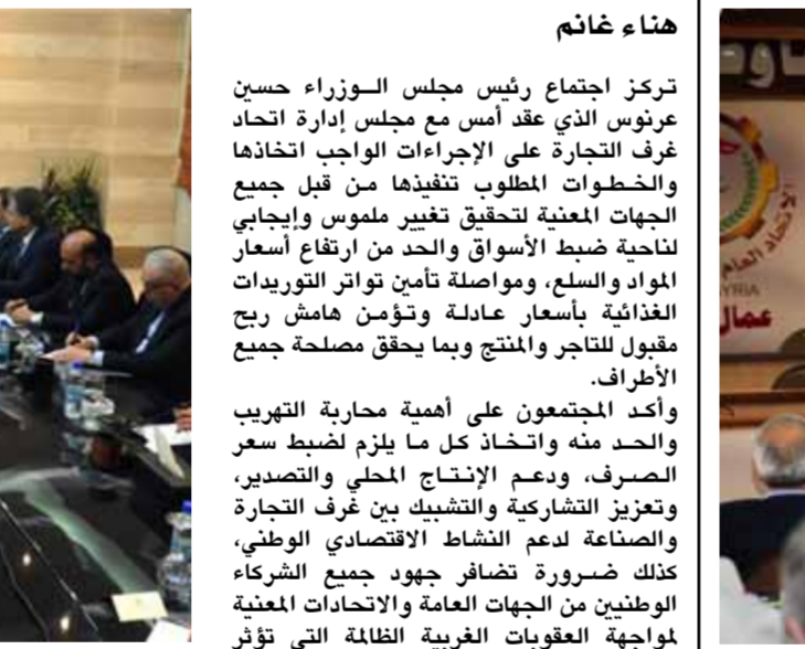
من اجتماع المجلس المركزي للاتحاد العام لنقابات العمال