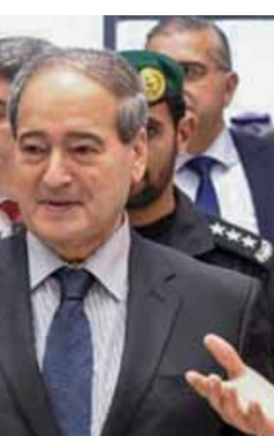
وزير الاقتصاد محمد سامر الخليل