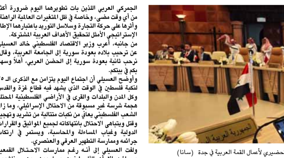
وتواصل الترحيب العربي بعودة سورية للمشاركة في اجتماعات الجمعية الاقتصادية والاجتماعية للأعمال

وتواصل الترحيب العربي بعودة سورية للمشاركة في اجتماعات الجمعية الاقتصادية والاجتماعية للأعمال السورية بدمشق، حيث ناقشوا أيضاً مع مسؤولي وزارة الخارجية السعودي فضلاً عن ممثلين من منظمة العفو الدولية، وبنسب المجتمع العالمي، حيث ناقشوا أيضاً مع مسؤولي وزارة الخارجية السورية. وتواصل الترحيب العربي بعودة سورية للمشاركة في اجتماعات الجمعية الاقتصادية والاجتماعية للأعمال السورية بدمشق، حيث ناقشوا أيضاً مع مسؤولي وزارة الخارجية السعودي فضلاً عن ممثلين من منظمة العفو الدولية، وبنسب المجتمع العالمي، حيث ناقشوا أيضاً مع مسؤولي وزارة الخارجية السورية.