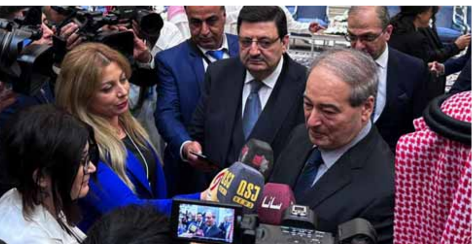
وزير الخارجية والمغتربين فيصل المقداد خلال تصريح صحفي في جدة