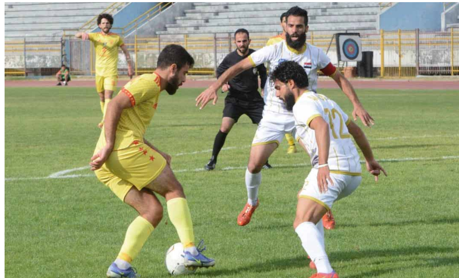
من فوز تشرين على المجد

حمص- إبراهيم البردان سيطر التعادل السلبلي دون أهداف على مباراة ديربي حمص بين الوئبة والكرامة، فيميرجات صامتة التشجيع بدأ الديربي بسيطرة وئبوية مطلقة على مباريات الشوط الأول بعدما أحرر كل من النقاط والرشو فرصاً محققة للتسجيل. حيث وجدت الحارس الكرماني المتألق أحمد الشخ والذي تألق بإبعاده أكثر من مرة خطرة على شبابه أبرزها تسديدة الكروما القوية التي أبعدها برؤوس أصابعه من الزاوية الشرس الكرماني لم يدخل في صلب المواجهة حتى الدقيقة ٣٢ حيث تصدى الرحال لتسديدة علي غصن القوية وبعد ذلك انتقلت سخونة الديربي إلى المدرجات بمشادات كلامية بين جماهير الفريقين وعلى ذلك الإيقاع انتهى شوط المباراة الأول.