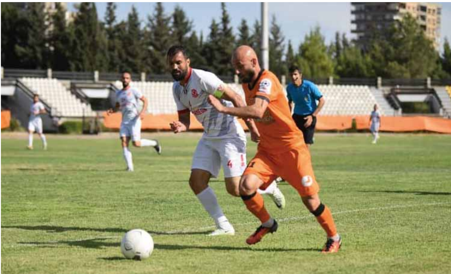
من تعادل الوحدة والطليبة

كانت فيه للطليبة الذي لاحت له أكثر من فرصة خطيرة وأبرزها لعبد الله تتان الذي انقذ بالحارس ووضعها فوق المرمى في الدقيقة ٦٠ والكرة الثانية الخطيرة ليوسف قفا التي تكفل حارس الوحدة والعارضة بإبعادهما في الدقيقة ٦٥، في حين لاحت بعض الفرص للاعبين الوحدة الذين اعتمدوا على المرتدات ولكن دون خطورة كان لها حارس الطليعة بالرصد، لينتهي المباراة بتعادل إيجابي عقد من حسابات الفريقين للبقاء في الدوري.