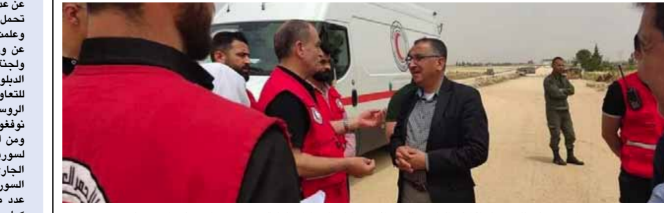
الاستعداد لاستقبال طلاب محافظة ادلب الوافدين للتقدم إلى امتحانات الشهادات العامة عبر معبر سراقب (عن الانترنت)

العلمي وبناء مستقبلهم. وعلمت «الوطن» أن الطلاب والطالبات الوافدين من المناطق الساخنة إلى حلب سيحصلون من منظمات دولية على مبلغ ٣٣٠ ألفيرة سورية لكل واحد منهم لتأمين احتياجات طعامهم بشكل يومي في أماكن محددة بدل تقديم الوجبات لهم في مراكز إقامتهم كما في السنوات السابقة، كما سيصطحب فريق قانوني بالتعاون مع الأمانة السورية للتنمية والهلال الأحمر العربي السوري عدداً معيناً من الطلاب الراغبين باستخراج الهويات الشخصية إلى مديرية السجل المدني بشكل يومي، إذ جرت العادة في كل امتحان أن تستفرد أعداد كبيرة من الطلاب والطالبات الهويات السورية الرسمية خلال تقديمها للامتحانات في حلب.