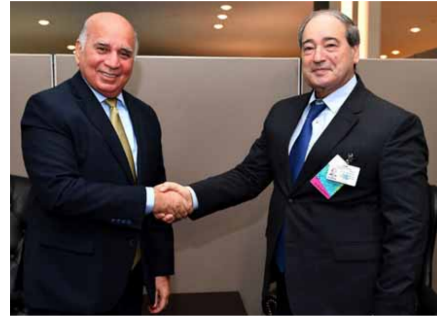
من لقاء سابق بين وزير الخارجية والمغتربين فيصل المقداد ونظيره العراقي فؤاد حسين (عن الانترنت - أرشيف)

وأوضح الوزير العراقي أن فريقاً عربياً ولجاناً واجتماعات مشتركة، ستكون متواصلة مع سورية لحين الاستقرار التام وإعادة الإعمار والبناء. وكان العراق من أوائل الدول التي سارعت لمساعدة السوريين بعد كارثة الزلزال في شباط الفائت وأرسل طائرات وقوافل مساعدات لصهايرح نطف وفرق إنقاذ إلى المناطق المنكسرة. وأعلن رئيس مجلس الوزراء العراقي محمد شياع السوداني، فتح بلاده جسراً جويّاً وأخر برياً، مع سورية لإرسال المساعدات الإغاثية العاجلة، التي تتضمن مواد طبية طارئة، وإسعافات أولية، ومستلزمات لإيواء والإغاثة، وكميات من الدواء والوقود.