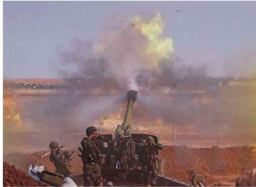
قوات الجيش العربي السوري في ريف ادلب