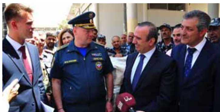
فوج إطفاء دمشق يتسلم من وزارة الطوارئ الروسية معدات وأدوات خاصة بإخماد الحرائق

بينما وصلت إلى مطار دمشق الدولي طائرة عمانية تحمل مساعدات إغاثية إلى المتضررين من الزلزال الذي ضرب شمال سورية في شباط الماضي، وقّعت سورية وروسيا أمس مذكرة تعاون في مجال الإطفاء والدفاع المدني، على حين وزعت موسكو مساعدات متنوعة في محافظات عدة. وحسب بيان لوزارة النقل، وصلت إلى مطار دمشق الدولي امس طائرة عمانية تحمل ٧٩ طناً من المساعدات الطبية والغذائية والإغاثية المتنوعة للمتضرري الزلزال.