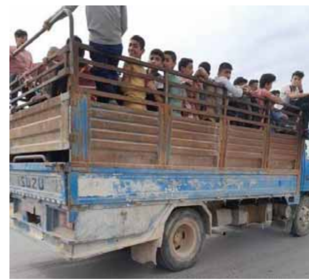
الطلاب قادمون من مناطق خارج السيطرة

وعن استعدادات مديرية تربية الرقة للعملية الامتحانية كشف مدير التربية في محافظة الرقة فراس العلو أن هناك أكثر من ٢١ ألف طالب وطالبة يستعدون للمشاركة في العملية الامتحانية الأساسية والثانوية في محافظة الرقة من ١٦ ألف طالب وطالبة جاؤوا من المناطق خارج السيطرة.