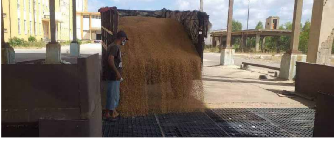
حمص- نبال إبراهيم

مدير المصرف الزراعي: ٢٥ مليار ليرة سورية حالياً جاهزة للصرف ثمن أقماح