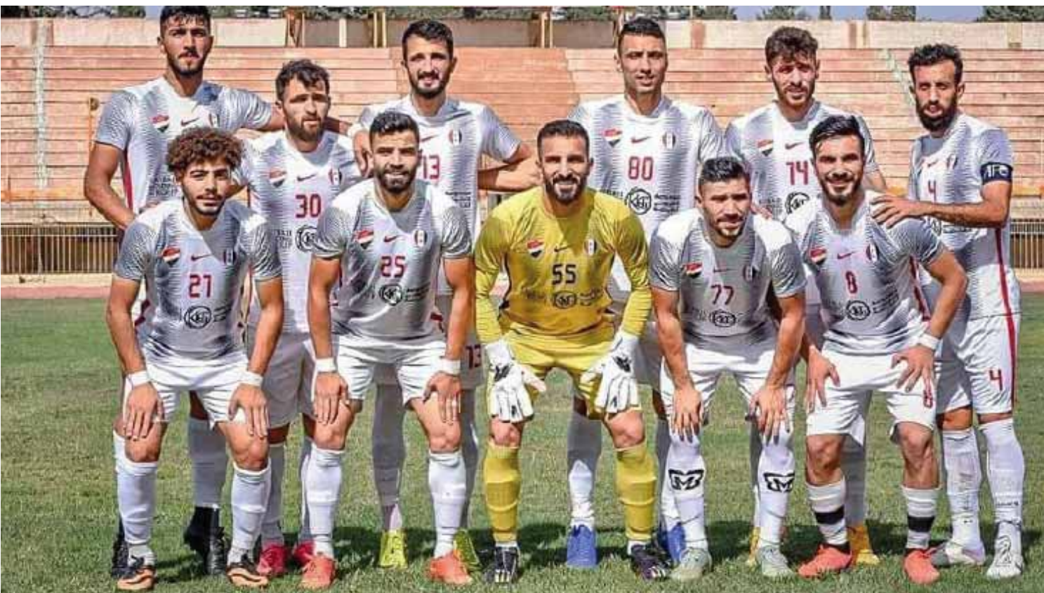
الأهلي يسخر لقلبه ويخرج صفر البيدين

في دور الـ١٦ من كأس الجمهورية لكرة القدم