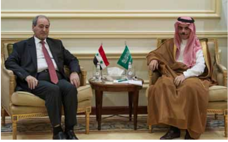
من زيارة سابقة لوزير الخارجية والمغتربين فيصل المقدماء في العاصمة السعودية الرياض

أكد أعضاء البرلمان العربي حرصه على دعم أمن واستقرار ووحدة وسيادة سورية، مرحباً بعودتها إلى الجامعة العربية والبرلمان العربي. وخلال الجلسة الخامسة من دور الانعقاد الثالث من الفصل التشريعي الثالث للبرلمان العربي، التي عقدت أمس بمقر الأمانة العامة لجامعة الدول العربية بالقاهرة، أعرب البرلمان العربي عن تطلعه لانخراط عربي أكثر بهدف التوصل إلى حل سوري-عربي خالص للأزمة في سورية بعيداً عن أي تدخلات خارجية. ونوه أعضاء البرلمان العربي بعودة البرلمانين السوريين إلى مقاعدكم في البرلمان العربي، متمنين لهم التوفيق والسداد في المهام المنوطة بهم. ودعا البرلمان الدول العربية والمجتمع الدولي والجهات المانحة إلى دعم ومساندة سورية من أجل النهوض بأوضاعها التنموية والاقتصادية والاجتماعية، وتبني مبادرات ومشروعات الاستثمارات على أرضها تسهم إيجابياً في تعزيز ملف التنمية وإعادة الإعمار والنمو المستدام. وعد البرلمان العربي اجتماعاته بمشاركة وفد برلماني سوري ترأسه عضو مجلس الشعب ورئيس الاتحاد العام للفلاحين أحمد صالح إبراهيم.