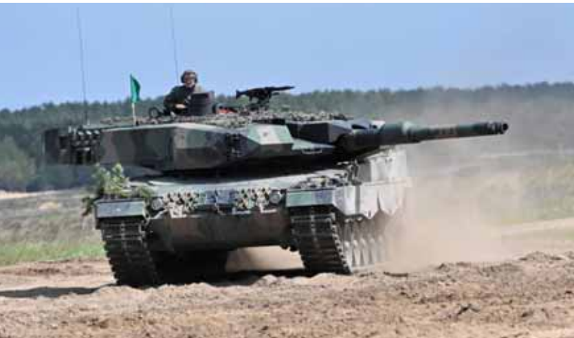
الدفاع الروسية أعلنت عن تصفيته نحو ٣٠٠ مسلح أوكراني وتدمير ٤ دبابتين من طراز «ليوبارد»

ومدركات أميركية أخرى على محور زاباروجيه. كما أعلنت القوات الروسية صد محاولة هجوم جديدة لقوات النظام الأوكراني على منطقة زاباروجيه، وقال رئيس حركة «نحن مع روسيا» فلاديمير روجوف، على قناته في «تلغرام»: «إن القوات الروسية ردت بقوة على محاولة وحدات القوات الأوكرانية شن هجوم جديد الليلة (قبل) الماضية على زاباروجيه». بدره أعلن رئيس جمهورية القرم الروسية سيرغي أكسيونوف أن الدفاعات الجوية الروسية اعترضت صاروخين باليستيين من نوع «غروم-٢» أطلقتها القوات الأوكرانية، من دون أن تقع إصابات أو أضرار مادية.