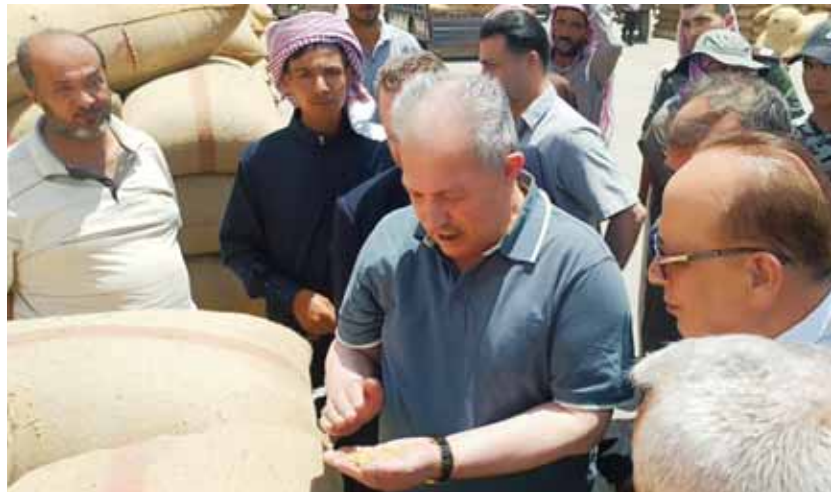
رئيس مجلس الوزراء حسين عرنوس يتفقد عمليات نقل واستلام الحبوب (عن الانترنت)

مدة ١٠ أيام مع قرب الانتهاء من استلام القمح من الفلاحين سيتم وضع المحلحة في الخدمة، وستتخذ نوعية دقيق ممتازة، وستكون رديفاً لباقى المطاحن في تأمين الدقيق واستقرار الأمن الغذائي في محافظة حماة بشكل خاص وسورية بشكل عام. كما تفقد عرنوس في جولته عمليات تسويق محصول القمح في مركز استلام الحبوب في كفر جوم بريف حلب الغربي الذي تبلغ الطاقة الاستيعابية له ١٢ ألف طن من القمح. كما تفقد مركز حبوب خان شيخون بريف إدلب المحرر. وفي تصريح صحفيين قال عرنوس خلال اطلاعه على مراحل العمل في مركز استلام الحبوب في كفر جوم وألية استلام الحبوب من الفلاحين وتقريبها