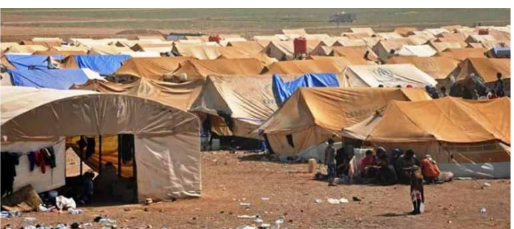
قوات الاحتلال الأمريكية ترافع فتكديم «الركبان» للحفاظ على ذريعة بقائها في قاعدة التنف، غير الشرعية (عن الانترنت)

قوات الاحتلال الأمريكي والتقطعات وإضافة إلى الوازم الخمسة لأكثر من ألف قروي.