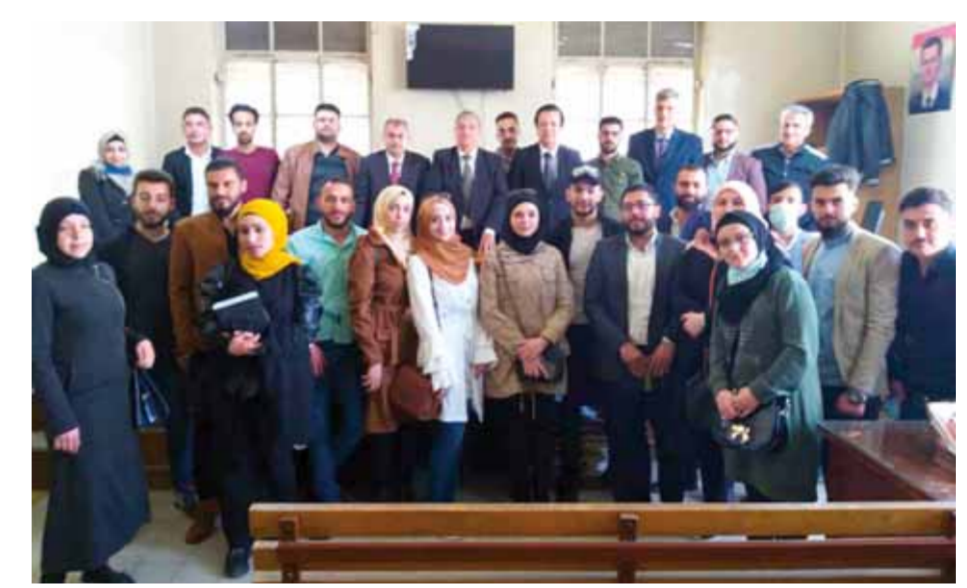
مع طلاب الحقوق