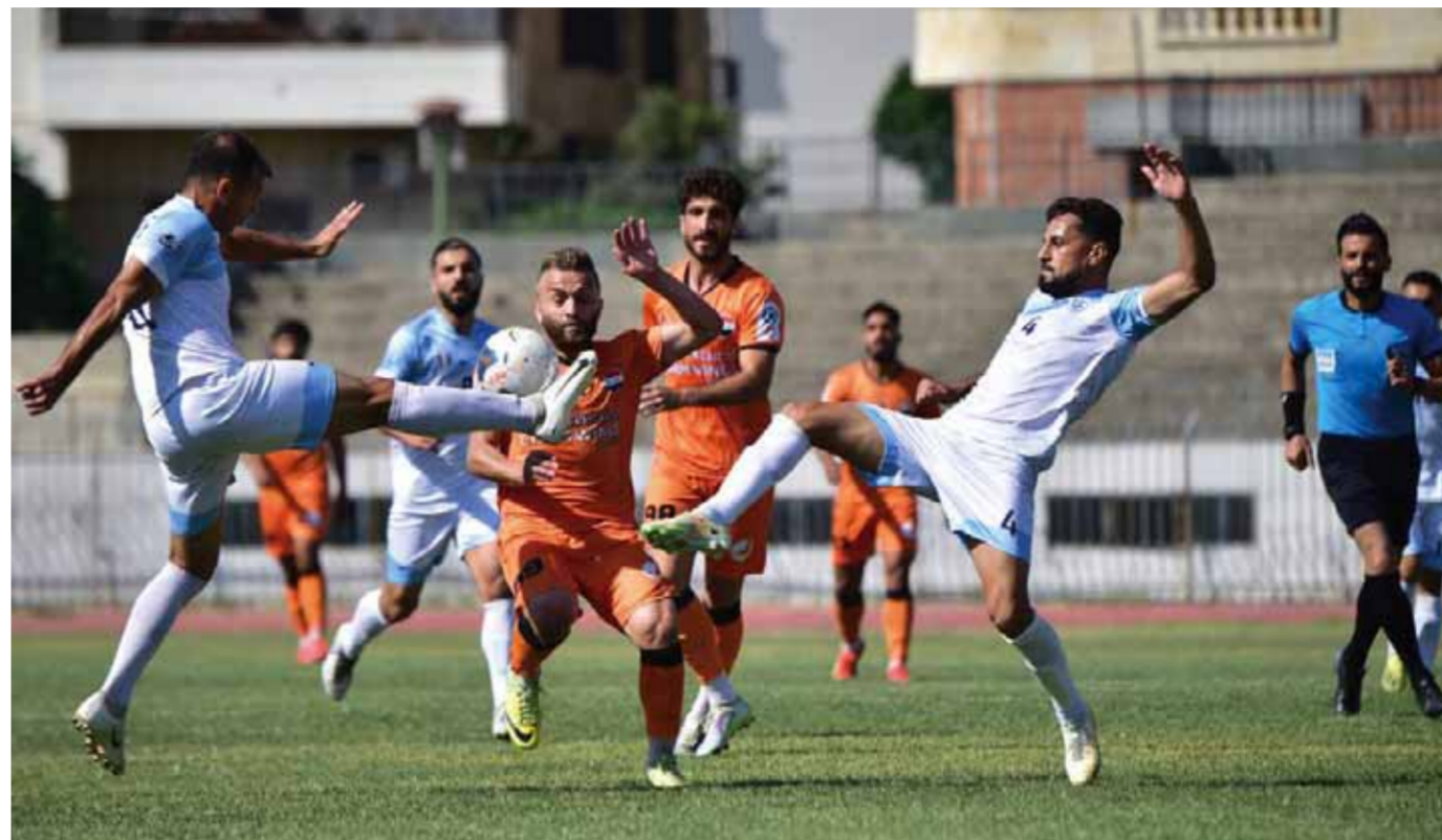
من المباراة

بدأت المواجهة خطورة وحدوية سرعان ما تكلت بالنجاح بهدف أول مبكر عند الدقيقة الخامسة حمل توقيع فراس كريم والذي استغل كرة عالية مرفوعة من وسط الملعب حيث وضع الكرة بمهارة بشباك حطين سجلاً هادفاً وحدوياً.