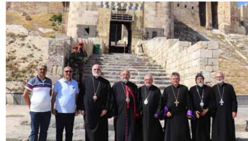
وفد البطاركة خلال زيارته إلى مدينة حلب

من الحكومة السورية تقديم ما يمكن من تسهيلات للمغتربين كي يتمكنوا من العودة لبلدهم والاستثمار فيها.