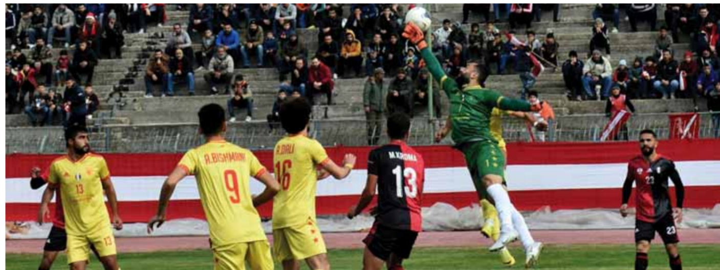
الوثبة وتشرين