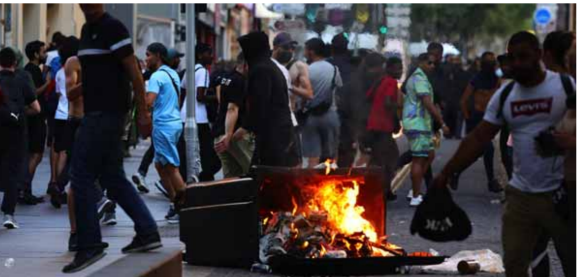
من اشتباكات المتظاهرين مع الشرطة في مرسيليا جنوب فرنسا

سورية وعلى لسان خارجيتها أدانت بقوة جريمة قتل الشباب ناهل في إحدى ضواحي باريس بدم بارد وبشكل متعمد، لافتة إلى أنها تضم صوتها إلى الجهات التي تدعو إلى وضع حد للمشاعر والسلوكيات العنصرية المتجذرة لدى أجهزة الشرطة والأمن الفرنسية والمسؤولين الفرنسيين، والتي تستهدف أساساً أبناء الجاليات، ما يعكس تأصل التفكير والعقلية الاستعمارية العنصرية، وهو الأمر الذي يكذب ما تدعيه الحكومة الفرنسية من قيم المساواة وعدم التمييز».