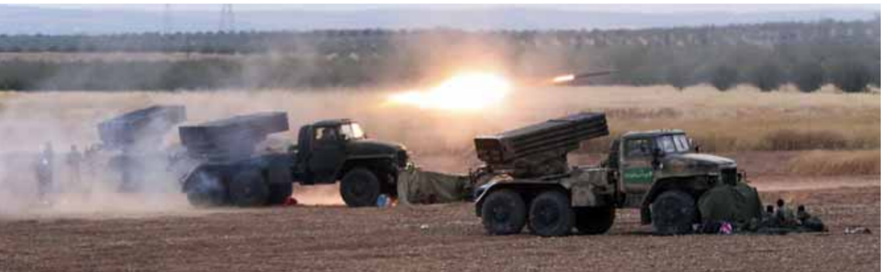
الجيش العربي السوري يستهدف الإرهابيين في «خفض التصعيد» (علن الانترنت)

ولفت المصدر إلى أن ضربات الجيش جاءت رداً على اعتداءات «النصرة» وحلفائه بالطيران المدفوع بالصواريخ والمسيرات على القرى الأمتة في سهل الغاب.