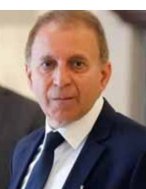
الوزير عصام شرف الدين