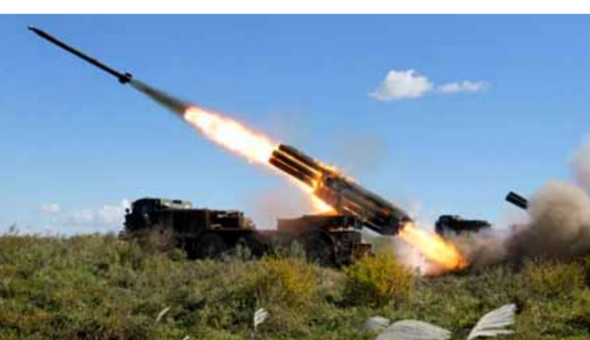
القوات الروسية تصد ١٧ هجوما على محور دونيتسك وتعيد ٦٥٠ جنديا (عن الانترنت)

المضاد نفسه تباطأ، بل توقف في بعض الأماكن، حيث يُكافح الجنود الأوكرانيون ضد الدفاعات الروسية الهائلة. وأقر رئيس الإدارة الرئاسية الأوكرانية أندريه برباك أول أمس بأن الهجوم المضاد لكيف الذي يواجهه مقاومة القوات الروسية «لا يجرؤ تقدماً سريعاً». على صعيد آخر اعتبرت موسكو أن محاولة اغتيال رئيسة تحرير شبكة «آر تي» مارغريتا سيمونيان، والصحفية كسينيا سوبتشاك، هي محاولة لهجوم إرهابي آخر لنظام كيف ضد المواطنين الروس. وقالت المتحدث باسم وزارة الخارجية الروسية ماريا زاخاروفا في تصريح لها أمس: «نحن نتحدث عن محاولة أخرى لهجوم إرهابي على المدنيين الروس، نظهما نظام كيف، ووعاما