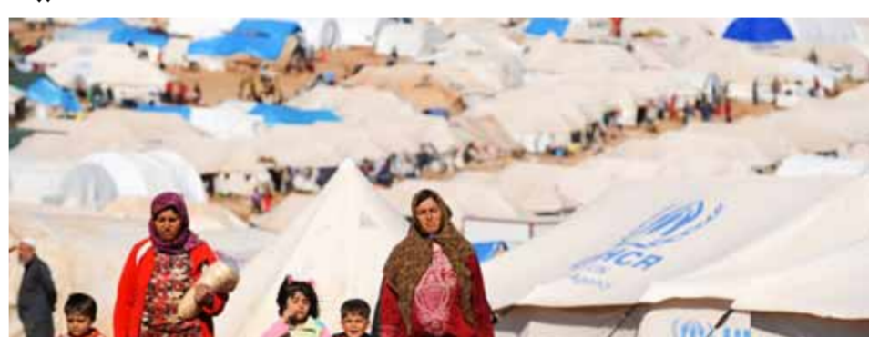
الحكومة اللبنانية ترفض القرار الذي يتناهى البرلمان الأوروبي حول إبقاء اللاجئين السوريين في لبنان

على وطننا ولا علاقة له بأي قرار يتعلق بعودة اللاجئين». وأكد شرف الدين أن «لبنان ملتزم بالقوانين والأعراف الدولية ولا سيما اتفاقية ١٩٥١ التي وقع عليها، وبالتالي للبنان الحق كلياً بالتنسيق مع الدولة السورية من دون العودة إلى أي من الأطراف الأخرى كعضوية شؤون اللاجئين أو الاتحاد الأوروبي أو غيره، وبالتالي نحن مستمرون بالتنسيق مع الدولة السورية»، مشيراً إلى أنه «سيكون هناك وفد رسمي لبناني سيؤرخ سورية قريباً». وحول وجود مشروع أميركي - أوروبي أو مؤامرة أميركية لتوطئ اللاجئين السوريين في لبنان أكد شرف الدين أن «كل هذه القرارات التي اتخذت في المرحلة الأخيرة جاءت لتفرض مشروع الاتفاق بين لبنان وسورية لتفرض عجلة العودة ضمن بروتوكول بين الدولتين»، وقال: «نعم هناك تأمر، وإن الحصار الجائر على سورية، حصار قبض، ومشروع أفكار لبنان المنهج، ومشروع (مساعد) وزير الخارجية الأميركي الأسبق جيفري فيلتمان)