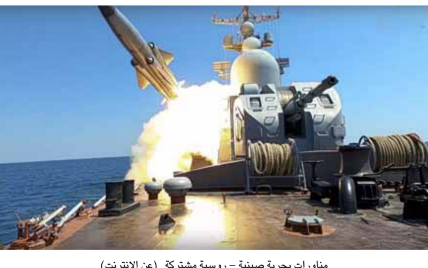
مناورات بحرية صينية - روسية مشتركة

صاحبت موسكو واشنطن وكيف مسؤولية مقتل صحفي روسي وإصابة عدد من زملائه بذخائر عنقودية في مقاطعة زابوروجيه أمس، في حين نفذت روسيا والصين ضربة مدفعية مشتركة على هدف بحري في إطار المناورات البحرية المشتركة «شمال-شمال» تقاعل ٢٠٢٣. نائب رئيس مجلس الاتحاد الروسي قسطنطين كوساتشيف، حمل واشنطن وكيف مسؤولية مقتل صحفي روسي وإصابة عدد من زملائه بذخائر عنقودية في مقاطعة زابوروجيه أمس. وكتب كوساتشيف عبر «تيلغرام»: استخدام الذخائر العنقودية غير إنساني ويجب استبعاد ومنع استخدامها في القتال، مضيفاً: ما حصل (أمس) يبين أن جميع تأكيدات الأميركيين والأوكرانيين بعدم وجود مخططات أوكرانية لاستخدام هذه الذخائر ضد المدنيين ثبت أنها أكاذيب، والمسؤولية عن ارتكاب جريمة استخدام هذه الذخائر تقع على عاتق أوكرانيا والولايات المتحدة على حد سواء. من جانبه قال نائب المندوب الروسي لدى الأمم المتحدة ديميتري بوليانسكي عبر «تويتر» تعليقا على مقتل جورا فلوف: إن الولايات المتحدة تخطت جميع الحدود الأخلاقية بإمداد أوكرانيا بالذخائر العنقودية. وأضاف: الذخائر العنقودية التي توفرها الولايات المتحدة لكيف تكفل الصحفيين في أوكرانيا، أتساءل عن توجهات الشارع الأميركي وأربابهم بتخطي حكومة بلادهم لجميع الخطوط الحمراء الأخلاقية، في محاولة بائسة لإقناع نظام كيف الفاسد والمنهار. وأعلنت وكالة «نوفوستي» الروسية أمس السبت مقتل مراسلها الحربي روستيسلاف جورا فلوف،