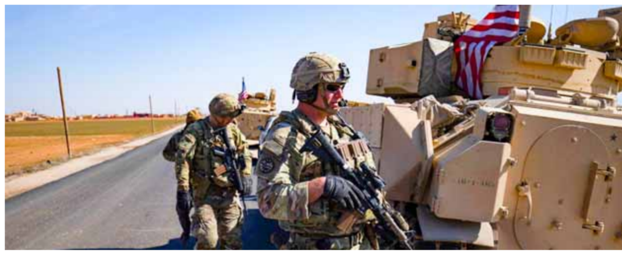
قوات لجيش الاحتلال الأمريكي في الشمال السوري

وواصل الاحتلال الأمريكي تعزيز قواته في مناطق شمال وشرق سورية المحتلة وتحدثت تقارير إعلامية عن ارتفاع عدد جنوده المعان عنهم إلى نحو ١٥٠٠ جندي. مصادر إعلامية معارضة كشفت أن «التحالف» أدخل صباح أمس رتلًا عسكريًا جديدًا إلى الأراضي السورية عبر معبر الوليد غير الشرعي قادماً من إقليم كردستان العراق، مشيرة إلى أن الرتل ضم ٢٠ عربة شحن تحمل على متنها مواد لوجستية وصناديق مغلقة وكتا إسمتية، حيث توجهت نحو قواعد في ريف الحسنة. ويتابع الاحتلال الأمريكي عمليات تحصين مواقفه في الشرق السوري المحتل عبر استقدام مزيد من المعدات العسكرية التي وصل آخرها من إقليم كردستان العراق الأربعة الماضية إلى المواقع النفطية السورية التي تحتلها واشتنط، واستقدم المزيد من قواته عبر دفعات وصل عددهم إلى ١٥٠٠، يشرفون على ميليشيات عديدة أبرزها «قوات سورية الديمقراطية - قسد»، وميليشيات «جيش سورية الحرة» في منطقة التنف المحتلة، وميليشيات أخرى من مكونات عربية تنتشر في الشرق السوري والرافقة. وقبل أيام أعلن «البنتاغون» إرسال طائرات مقاتلة متطورة من طراز «إف ٣٥»، و«إف ١٦»، ومدمة تابعة للبحرية إلى الشرق الأوسط بزعم «صد المناورات المتزايدة التي يقوم بها الطيارون الروس فوق سورية». على الضفة المقابلة، اعتبرت القبائل والعشائر العربية في الجزيرة السورية أن «تجربة