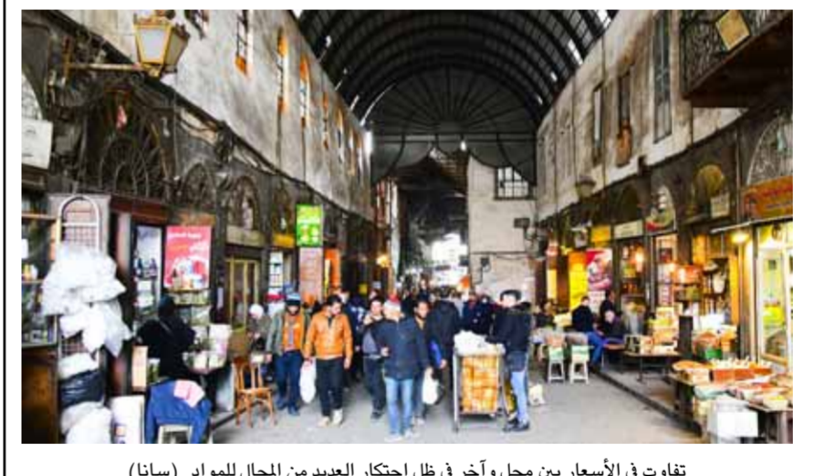
تفاوت في الأسعار بين محل وآخر في ظل احتكار العديد من المحال للمواد (سانا)