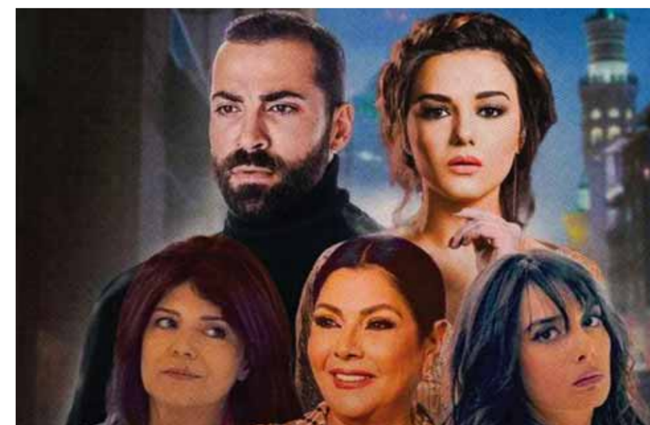
من مسلسل «عزك يا شام»