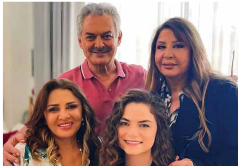
من مسلسل «ترانزيت»