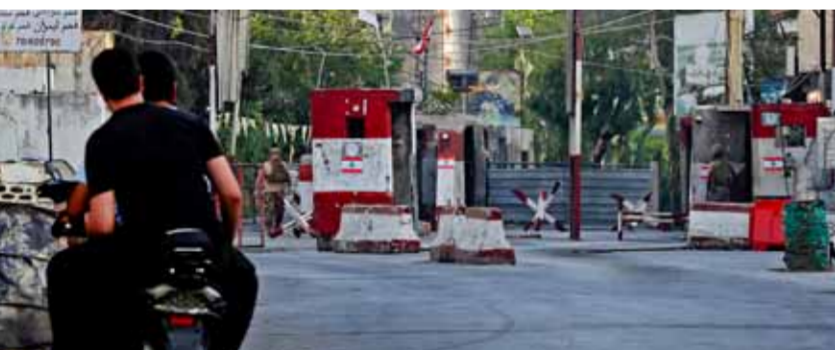
حاجز للجيش اللبناني على مدخل مخيم «عين الحلوة» للاجئين الفلسطينيين