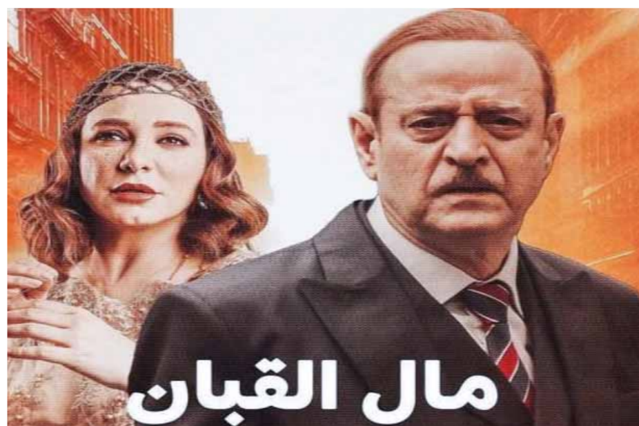
من مسلسل «مال القبان»