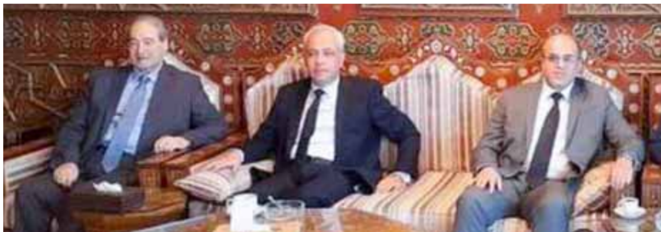
وزراء الخارجية والمغتربين والاتصالات والتقانة والاقتصاد والتجارة الخارجية في مطار دمشق الدولي قبيل مغادرتهم إلى طهران