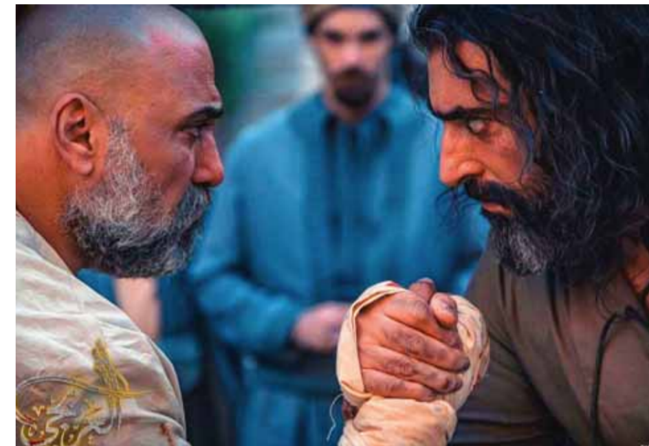
من مسلسل «العربي»