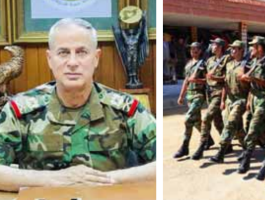
من الاحتفالات بعيد الجيش العربي السوري العام الماضي مدير الإدارة السياسية اللواء حسن سليمان

سليفا رزوق أكد مدير الإدارة السياسية اللواء حسن سليمان على أهمية الدور الوطني المحوري الذي لعبه الجيش العربي السوري منذ التأسيس حتى اليوم، في حماية سورية وتحصينها في مواجهة جملة الأخطار والتحديات والمشاريع الخارجية الاستعمارية عبر التاريخ، وضمن لها موقعاً مرموقاً ومكانة مهمة في المنطقة والعالم. ويحيي السوريون اليوم الذكرى الثامنة والسبعين لتأسيس الجيش العربي السوري، حامي أرضهم وكرامتهم واستقلالهم طوال عقود لم تهدأ فيها العواصف والمؤامرات. والجيش الذي عرفه السوريون ومنذ تأسيسه جيشاً عقائدياً مضمحياً في سبيل سيادة واستقلال وعزة البلاد، لم يحد عن عقيدته التي حملها شعاره «وطن شرف إخلاص»، ليتجسد هذا الشعار قولاً وفعلاً وليكتب رجاله ملاحم عزة ممزوجة بدماء شهدائه الطاهرة التي بذلت بسخاء لحماية سورية من كل معتد. وخلال مقابلة خاصة مع «الوطن»، بين اللواء سليمان أن الحرب الشرسة العدوانية على سورية هي من أعقد أنواع الحروب، كونها لا تندرج ضمن أي سياق تقليدي، ولأسباب في ظل الدعم المتواصل والمتنوع الذي تقدمه أطراف معروفة في مقدمتها الولايات المتحدة الأمريكية للتنظيمات الإرهابية المسلحة، ولذا فإن من الصعب على عاقل أن يتصور جيشاً في العالم قادراً على مواجهة والصمود وتحقيق الإنجازات في