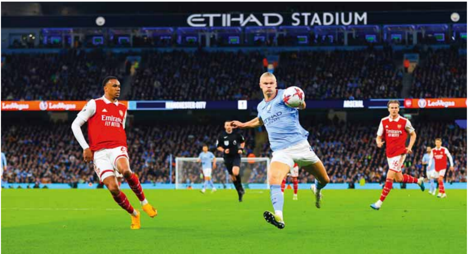
هل يتوج السيتي بلقب الرابع على حساب الأرسنال؟

يفتح اليوم رسمياً موسم الكرة الإنكليزية على مستوى الكبار بمباراة الدرع الخيرية التي تعد بمنزلة كأس السوبر في بلاد الضباب وتجمع عادة بطلَي الدوري والكأس هناك إلا أن الاتحاد الإنكليزي لكرة القدم لا يعتبرها منافسة رسمية بل كرتيلاً جماهيرياً إيداً بانطلاق الموسم الكروي، وتجمع مباراة الدرع هذا الموسم مانشستر سيتي بطل الفئانية (الدوري والكأس) مع وصيفة وريبرميلغ والاتحاد وكان ذلك عام ١٩٩٢ عندما هزم الاتحاد في نهائي الكأس. أندية عديدة خسرت نهائي الكأس فضاء حلم الفئانية في العام ذاته وفق التالي: البداية خسرت مع الاتحاد ١٩٦٨ عندما خسر أمام الجيش ٢/١ وصفر/٥. وأخفق الاتحاد ثانية عام ١٩٦٨ عندما خسر أمام الشرطة ٢/١ وصفر/٢. ولم يفلح جبلة عام ٢٠٠٠ عندما خسر أمام الجيش ١/٤. الجيش زعيم المسابقاتين أخفق ثلاث مرات، فعام ٢٠٠١ خسر أمام حطين بهدف، وعام ٢٠١٣ خسر أمام الوحدة بهدف أيضاً، وعام ٢٠١٦ خسر أمام الوحدة بنتيجة