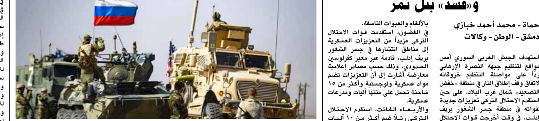
قوات من الجيش الروسي والاحتلال الأميركي في شمال شرق سورية

أكدت أن حشود واشتنق العسكرية في المنطقة للردع واستعراض العضلات، مصادر لـ«الوطن»: «الصدام الروسي-الأميريكي في أجواء مناطق شرق الفرات والتنف مستبعد