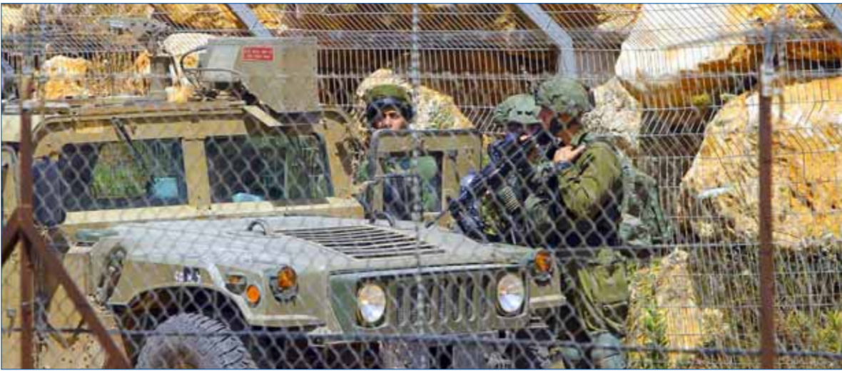
إطلاق ورشة تعبيد طريق برك بتعاقب السماسة في شمال كرشوبيا المحررة جنوب لبنان وسط حالة استقرار من جنود الاحتلال الإسرائيلي (من الانترنيت)

في وقت أكد فيه وزير الأشغال العامة في حكومة تصريف الأعمال اللبنانية علي حمية كما تعهدت إسرائيل بالحدود اللبنانية في فلسطين المحتلة، أعلن وزير الخارجية عبد الله محيبي رفض بلاده صيغة التمديد المقترحة في مجلس الأمن الدولي لولاية الأمم المتحدة المؤقتة في لبنان، «يونيفيل»، لأنها لا تشمل إلا ضرورة تنفيذ مهام هذه القوة مع الجيش اللبناني، وتقرر نقل ولايتها إلى الفصل السابع من ميثاق الأمم المتحدة، وذلك بالتزامن مع مطالبته حزب الله بكف يد أميركا عن لبنان. وألحقت إصلاحه ورشة تعبيد طريق برك بتعاقب السماسة في شمال كرشوبيا المحررة جنوب لبنان، وسط حالة استقرار من جنود الاحتلال الإسرائيلي، وذلك في إطار تنفيذ مهام هذه القوة مع الجيش اللبناني، وتقرر نقل ولايتها إلى الفصل السابع من ميثاق الأمم المتحدة، وذلك بالتزامن مع مطالبته حزب الله بكف يد أميركا عن لبنان.