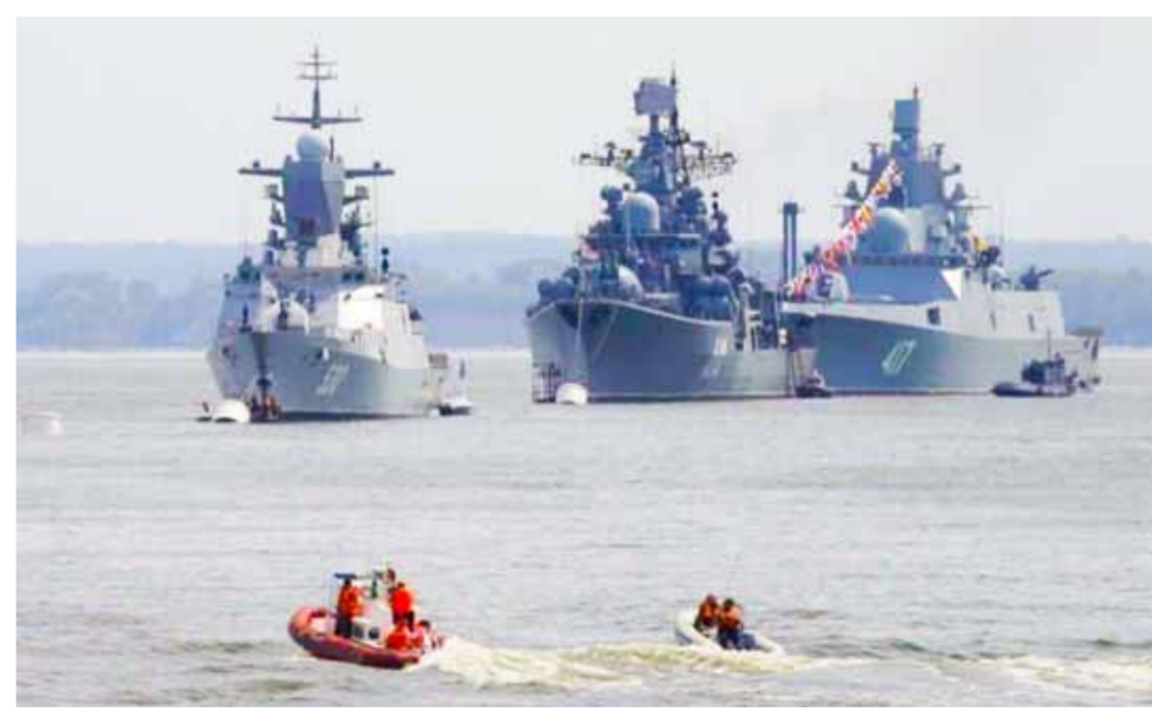
أسطول الشمال الروسي أجرى تدريبات في بحر بارنتس على منع مرور السفن غير الخاضعة لسيطرة وأيضاً تصاريح السفن الأجنبية (من الانترنيت)

أكدت موسكو أمس السبت استمرار التعاون العسكري الوثيق مع إيران، مشيرة على استئناف فرار السفن من ميناء الصمد، وبعد ثلاثين عاماً من إيداعها في أرخبيل، وأدت مع جانب آخر أن اعتبارات غير مباشرة تتعلق بالانطلاق من جانب آخر، أشارت المملكة الروسية بصراحة كيف بشأن عدم الاعتراف بالانتخابات في المناطق الجبلية، وباسم وزارة الخارجية الروسية التي انضمت إلى السيادة الروسية نظراً أهمية العملية العسكرية الخاصة بحماية بوشان. وحسب وكالة «نوفوستي»، أكد نائب وزير الخارجية الروسي سيرغي ريابكوف استمرار التعاون العسكري الثنائي بين بلاده وإيران وعدم إجراء تدريبات عسكرية مشتركة في بحر بارنتس، مؤكداً على أهمية العلاقات مع الجانب الإيراني، و«نحن نرى في إيران شريكاً دائماً في العلاقات الثنائية». وأضاف ريابكوف أن العلاقات الثنائية بين البلدين جيدة، و«نحن نرى في إيران شريكاً دائماً في العلاقات الثنائية».