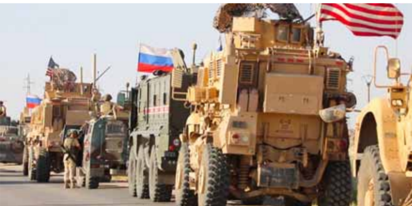
قوات من الجيش الروسي والاحتلال الأمريكي في شمال شرق سورية (عن الانترنت - أرشيف)

تحقيق «توافق» بين «قسد» وباقي مكوناتها من القبائل العربية المتناحرة على النفوذ مع الميليشيات والمتصارعة فيما بينها على دورها المستقبلي والمنقسمة حول جدوى وأهمية التحالف مع الاحتلال الأميركي لتنفيذ أجندته الجديدة في المنطقة بإغلاق الحدود السورية-العراقية، والذي يعتبر خطاً أحمر لدولة إقليمية فاعلة في الملف السوري ولروسيا الراضة لمزيد من الهيمنة الأميركية على مقدرات الشرق السوري. المصادر توقعات أن يقتصر التصعيد العسكري في دير الزور على تبادل الرسائل عند ضفتي نهر الفرات على شكل حشود عسكرية.