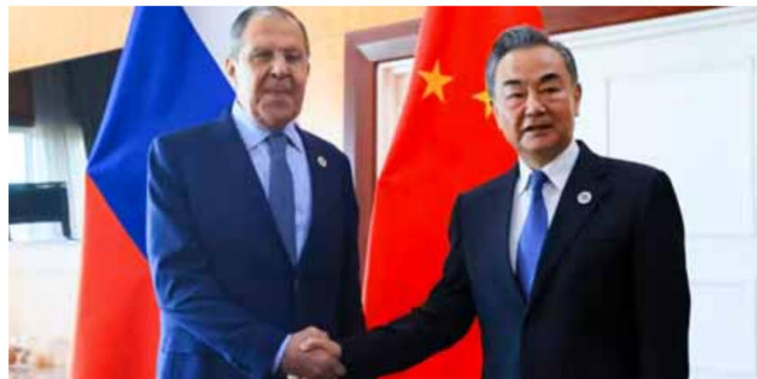
من لقاء سابق بين وزير الخارجية الصيني ونظيره الروسي

موفقاً تجاه ما تسمى بصيغة زيلينسكي للسلام، والتي يحاول نظام كييف والغرب الترويج لها في مثل هذه الاجتماعات». وشدت على أنه لا يوجد أي نقطة من النقاط العشر في «صيغة السلام» التي طرحها زيلينسكي تهدف إلى إيجاد حل تفاوضي ودبلوماسي للأزمة، وأن مجملها إشارات نهائية لا معنى لها تهدف إلى إطالة أمد القتال، وأكدت أن التسوية مستحيلة على هذا الأساس. وأضافت: «من خلال الترويج لـ«صيغة» زيلينسكي، يحاول نظام كييف والغرب التقليل من الأهمية الكبيرة لمقترحات السلام للدول الأخرى واحتكار الحق في اقتراحها، وفي الواقع، هناك معركة ضد الأفكار المعارضة على الصعيد الدولي».