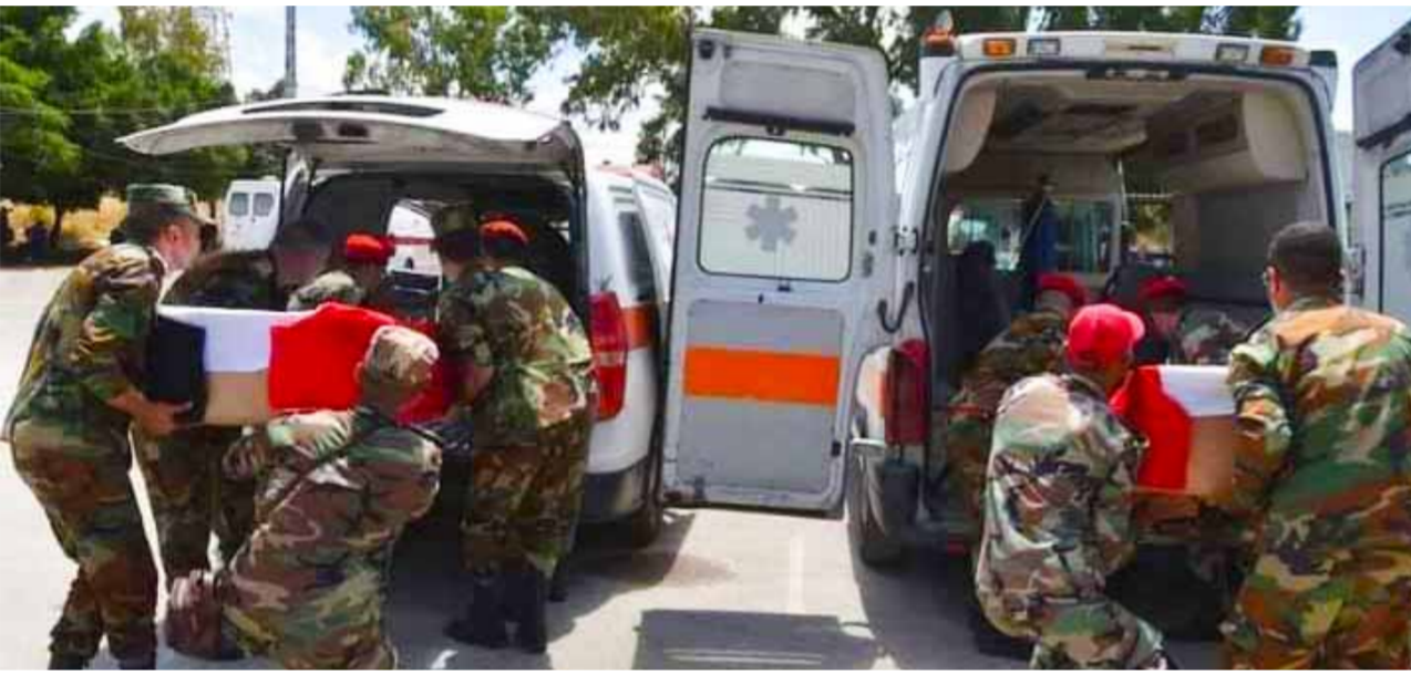
من تشييع شهداء العدوان الإسرائيلي أمس (عن الانترنت)

فلسطين - القيادة العامة في بيان تلقت «الوطن» نسخة منه عقب اجتماع لجنتها المركزية أن الحصار الاقتصادي والضغوط التي تتعرض لها سورية وإيران بعد سقوط أهداف العدوان العسكري والأمني لن يؤثر في صلابته موقفيهما المبدئي تجاه قضايا الأمة والذي يجسد الرئيس بشار الأسد وقائد الثورة الإسلامية في إيران علي الخامنئي. وقال البيان: «أثنت الأحداث والوقائع ذلك حيث فشلت سياسات الاحتواء التي تهدف إليها قوى العدوان المختلفة».