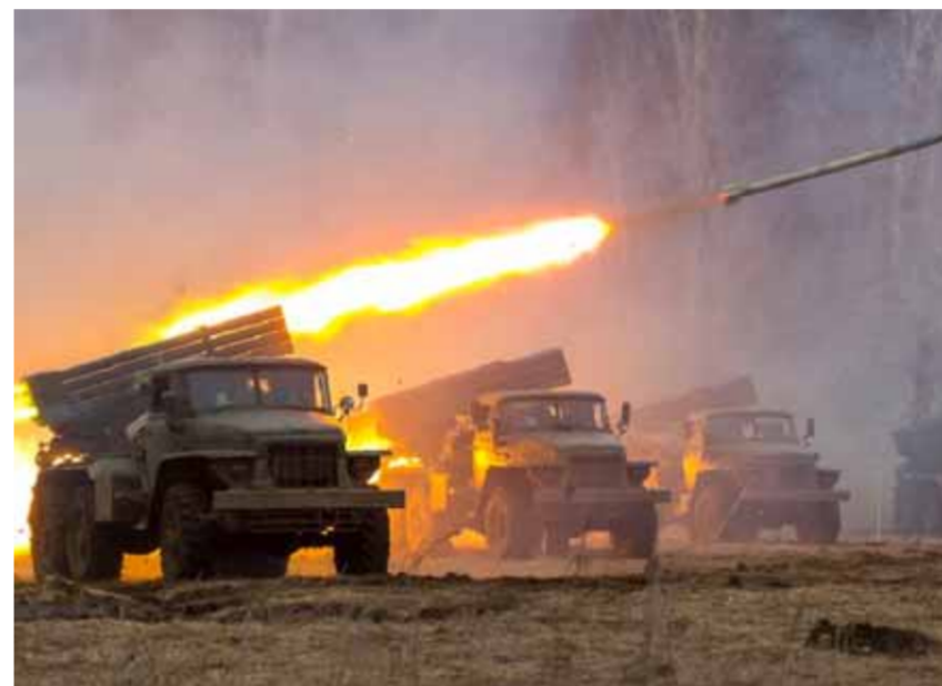
الجيش السوري استهدف مواقع النصر في محاور سهل الغاب الشمالي الغربي

عن تضامنا مع سورية حكومة وشعباً في تقاضهم ضد الإرهاب». وأكدت الوزارة أن الوجود الأميركي العسكري غير الشريعي في سورية هو أحد العوامل الرئيسة المزعزعة لاستقرار المنطقة، مشددة على أن التهديد الرئيسي للأمن في سورية يأتي من المناطق التي لا تخضع لسيطرة الحكومة السورية. وتابع البيان: إن «سياسة واشنطن الرامية إلى الحفاظ على احتلالها لمناطق شاسعة في شمال شرق سورية، تتميز ببروتها بالنطف والغاز والموارد الزراعية، واستمرار ضغط العقوبات على دمشق يؤذي في