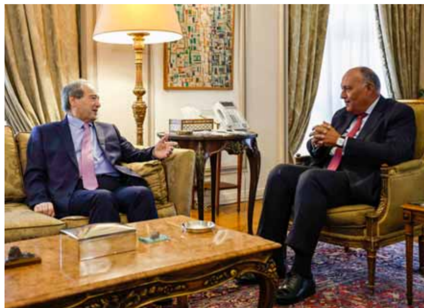
الوطن - وكالات

يجري وزير الخارجية والمغتربين فيصل المقداد الذي وصل إلى القاهرة مساء أمس مع نظيره المصري سامح شكري مباحثات ثنائية اليوم، ويشارك بعد ذلك في أعمال اجتماع لجنة الاتصال العربية التي أقرتها الجامعة العربية بخصوص تنفيذ مخرجات اجتماع عمان التشاوري، حيث من المقرر أن يلتقي بنظرته من خمس دول عربية وهم وزراء خارجية السعودية والعراق ومصر والأردن ولبنان. ومن المقرر أن يعقد شكري والمقداد اليوم جلسة مباحثات ثنائية بمقر وزارة الخارجية في ماسيرو بالقاهرة، يليها المشاركة في اجتماع لجنة الاتصال الوزارية العربية المعنية بسورية، يعقبه اجتماع اللجنة مع المقداد. وزارة الخارجية المصرية قالت في بيان لها: إن مشاركة المقداد في اجتماع لجنة الاتصال الوزارية العربية المعنية بسورية، لعقد جلسة مباحثات بشأن التطورات السورية، تأتي على خلفية استئناف سورية لشغل مقعدها في جامعة الدول العربية.