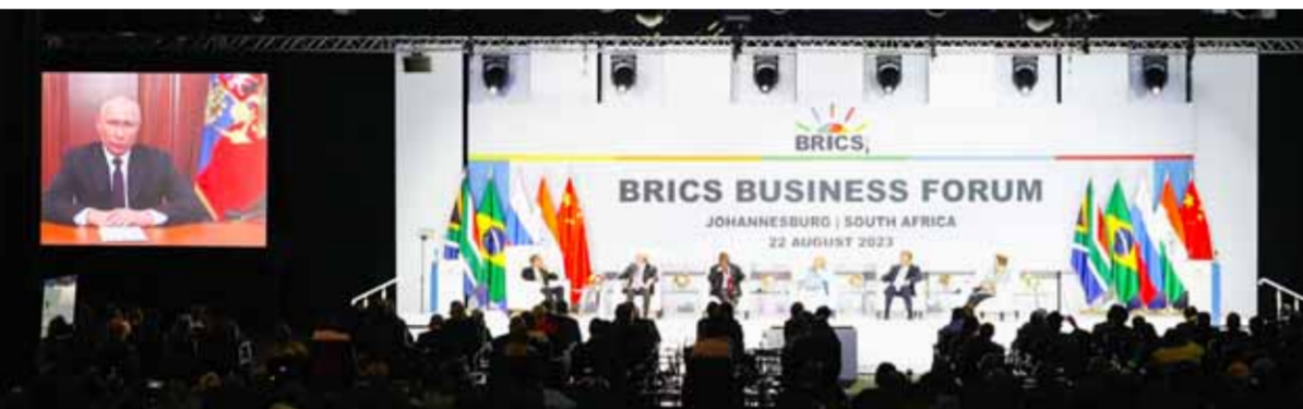
الرئيس الروسي يلقي كلمة عبر تقنية الفيديو خلال أعمال قمة دول مجموعة «بريكس» في جوهانسبورغ (أ ف ب)

وكشف مودي أن الهند لديها ثلث الشركات التكنولوجية في العالم، ولاسيما في تكنولوجيا أشباه الموصلات.. من جهته، أعرب الرئيس البرازيلي لويس إيناسيو لولا دا سيلفا في كلمة له خلال القمة عن تأييده فكرة إنشاء عملة موحدة لمجموعة «بريكس»، وقال: «لكني بنمو الاستثمار يجب علينا أن نضمن نمو الثقة والقدرة على التنويع والاستقرار القانوني والسياسي والاجتماعي للقطاع الخاص. لذلك أنا أؤيد تبني عملة موحدة، لا تحل محل عملاتنا الوطنية». رئيس جنوب إفريقيا سيريل رامافوزا طالب بإجراء إصلاح جوهري في النظام المالي العالمي، وأعلن في كلمته أن بنك التنمية التابع لمجموعة «بريكس» مستعد لمساعدة مختلف الدول، داعياً رجال الأعمال إلى مد يد العون من أجل وضع أجندة للتنمية تخرج الجميع من قبضة الفقر.