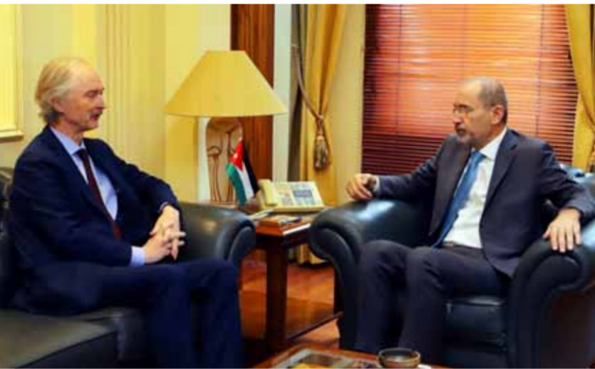
من لقاء سابق بين وزير الخارجية الأرميني مع المبعوث الأممي الخاص إلى سورية

إزاء خطوة لجنة الاتصال العربية حول استضافة سلطة عمان لاجتماعات «الدستورية».. المصادر اعتبرت أن بيدرسون يبدو بانتظار صدور موقف أمريكي رسمي تجاه الخطوة العربية، لاسيما أن واشنطن لم تعلق حتى اللحظة على إمكانية استضافة عمان لاجتماعات «الدستورية». وكان البيان الختامي لاجتماع لجنة الاتصال العربية الذي عقد في الـ ١٥ من الشهر الجاري في العاصمة المصرية القاهرة بمشاركة وزير الخارجية والمغتربين فيصل المقداد، أكد أن الحل الوحيد للأزمة السورية هو الحل السياسي، وأعرب المشاركون فيه عن التطلع إلى استئناف العمل في المسار الدستوري السوري، وعقد الاجتماع المقبل للجنة الدستورية السورية في سلطنة عمان بتسهيل وتنسيق مع الأمم المتحدة قبل نهاية العام الجاري.