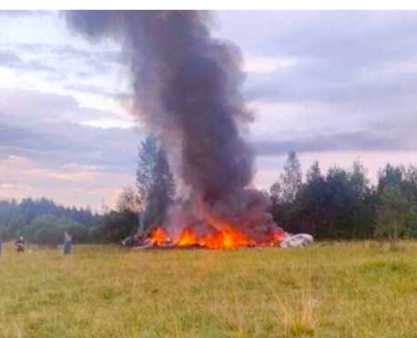
حطام الطائرة التي كان على متنها قائد مجموعة «فاغنر» العسكرية يفغيني بريغوجين

جو بايدن على حادث تحطم الطائرة التي كان بريغوجين على متنها وأدى لمقتل جميع ركابها الـ١٠، وذلك حسب ما أوردت وكالة «رويترز». وكان بريغوجين قد ظهر أول أمس الثلاثاء في مقطع فيديو قال فيه: إنه عائد إلى إفريقيا لمحاربة إرهاب تنظيم «القاعدة» وغيره من العصابات الإرهابية. وقال بريغوجين في الفيديو: «نعمل في درجات حرارة تصل إلى ٥٠ مئوية كما نحب، مجموعة فاغنر تجعل روسيا عظيمة في جميع القارات، وتجعل إفريقيا أكثر حرية وتقر العدل».