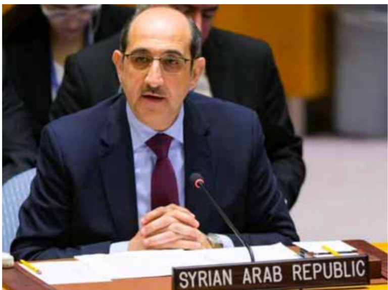
مندوب سورية الدائم لدى الأمم المتحدة السفير بسام صباغ

وتنسيق مع الأمم المتحدة قبل نهاية العام الجاري، والمطلوب هو احترام هذا الموقف الذي يعبر عن إصرار الدول العربية على دعم سورية، وحرصها على وحدتها، وإنهاء التدخل في شؤونها الداخلية، كما ربح البيان بالاتفاق الذي تم التوصل إليه بين سورية والأمم المتحدة في السابع من الشهر الجاري بشأن إيصال المساعدات الإنسانية عبر معبر باب الهوى الحدودي لمدة ستة أشهر، وقرار سورية تمديد فتح معبري باب السلامة والراعي لمدة ثلاثة أشهر. وخلال جلسة مجلس الأمن ربح المبعوث الأممي الخاص إلى سورية غير بيدرسون إعادة انعقاد اللجنة الدستورية في سلطنة عمان، معتبراً أن هذا يشكل نقطة توافق واضح بضرورة إعادة انعقادها بين كل الأطراف. وأشار بيدرسون إلى اتصال هاتفي أجراه مع وزير الخارجية والمغتربين فيصل المقداد أمس مؤكداً مواصلة السعي لتسهيل التوافق للتغلب على القضايا التي حالت من دون انعقاد اللجنة الدستورية، وضمان استئناف أعمالها وإحراز تقدم، وأضاف: «تواصلت في الأيام الماضية مع وزراء خارجية مصر والأردن والسعودية، وكذلك مع المسؤولين الأتراك، وسأواصل العمل مع الأطراف العربية والغربية لدعم العملية السياسية السورية». وأكد بيدرسون الحاجة لمضاعفة الجهود لتأمين موارد إنسانية كافية، في وقت يعاني تمويل المساعدات الإنسانية من ضغوط غير مسبوق، وقال: «كما يجب تعزيز عملية التعاون المبكر».