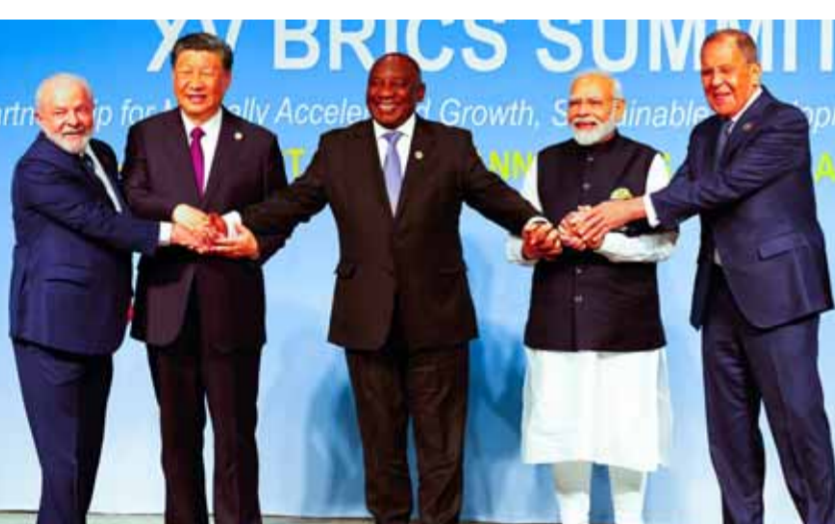
تواصل أعمال قمة دول مجموعة «بريكس» لليوم الثاني في مدينة جوهانسبرغ في جنوب إفريقيا

«بريكس»، يجب ألا ننسى هدفنا الأساسي، وهو الاتحاد وتعزيز التعاون الدولي وتطوير وتوفير الاستقرار». ووجهت، أكد الرئيس الروسي فلاديمير بوتين في كلمة له عبر الفيديو أن المجموعة تتفق مع فكرة عالم متعدد الأقطاب، مؤكداً أن هذا التكتل يكافح ضد الدول الاستعمارية، التي تسعى للحفاظ على هيمنتها على الساحة الدولية. وقال بوتين: إن مجموعة «بريكس» تؤدي تشكيل نظام عالمي متعدد الأقطاب، يعتمد على القانون الدولي، بما في ذلك حقوق الشعوب في التنمية، وتابع: «الخصامية رسخت نفسها على الساحة العالمية، بدافعها عن رأي الأغلبية العالمية»، مضيفاً: إن دول «بريكس» تعارض الهيمنة والسياسات الاستعمارية الجديدة.