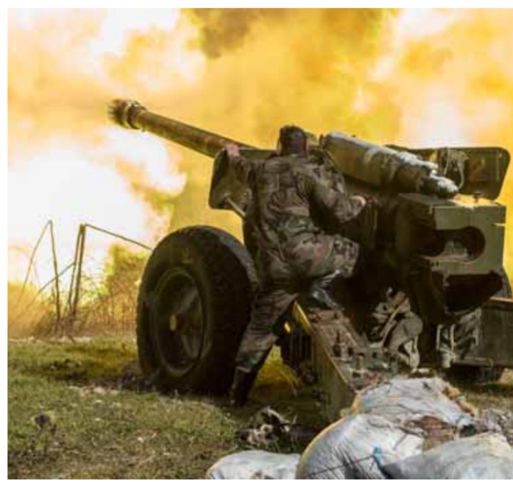
الجيش السوري تصدى لهجوم عنيف نفذته تنظيم «النصرة» الإرهابي في ريف إدلب

ولفت المصدر إلى أن وحدات الجيش دكت بالمدفعية الثقيلة والصواريخ أيضاً، مواقع الإرهابيين في جسر الشغور بريف إدلب الغربي، وفي الفطيرة وقرعويد وسفوفن وكنسفرة وعين لروز في جبل