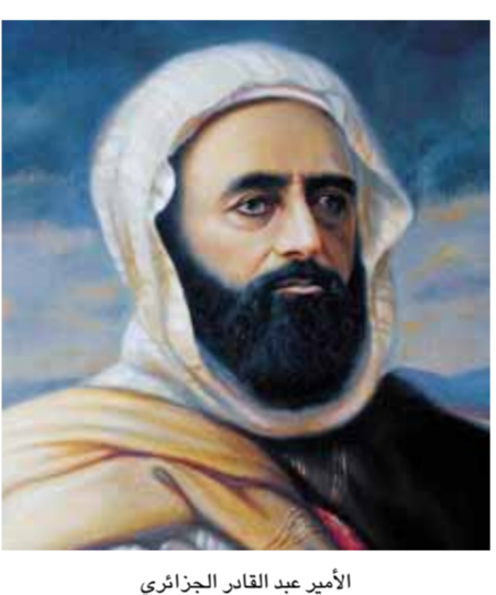
الأمير عبد القادر الجزائري

الحديث عن محمد الحريري هو حديث عن مرحلة كاملة من تاريخ سورية الحديث، حديث عن الاحتلال الفرنسي الذي أنركه في صباحه، وحديث عن الاستقلال وشخصياته، وحديث عن الدولة المستقلة حديثاً، وحديث عن ثورة التيارات الفكرية والسياسية التي ملأت الأرض السورية، وحديث عن الصراعات الإيديولوجية بين ديني ووضعي، وحديث عن نهضة الإنسان السوري في منتصف القرن العشرين.