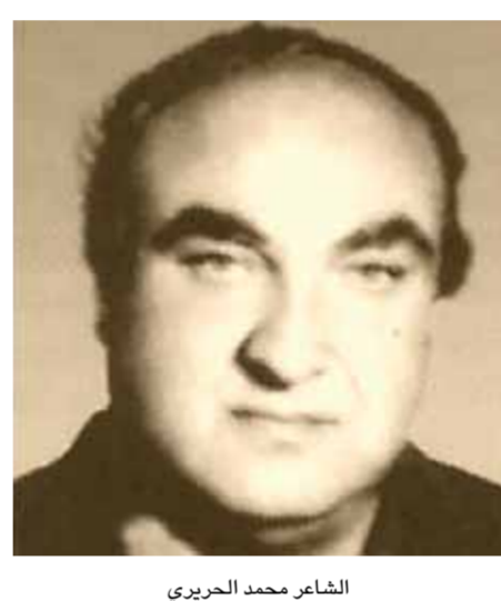
الشاعر محمد الحريري