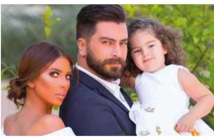
معتمص النهار مع زوجته وابنته

أعلنت مضممة الأزياء علماء البيسوي تطلقا من الفنان المصري بشكل مفاجئ، لافتة إلى أنه كان قراراً نابعا من الأخير