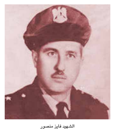
الشاعر محمد الحريري