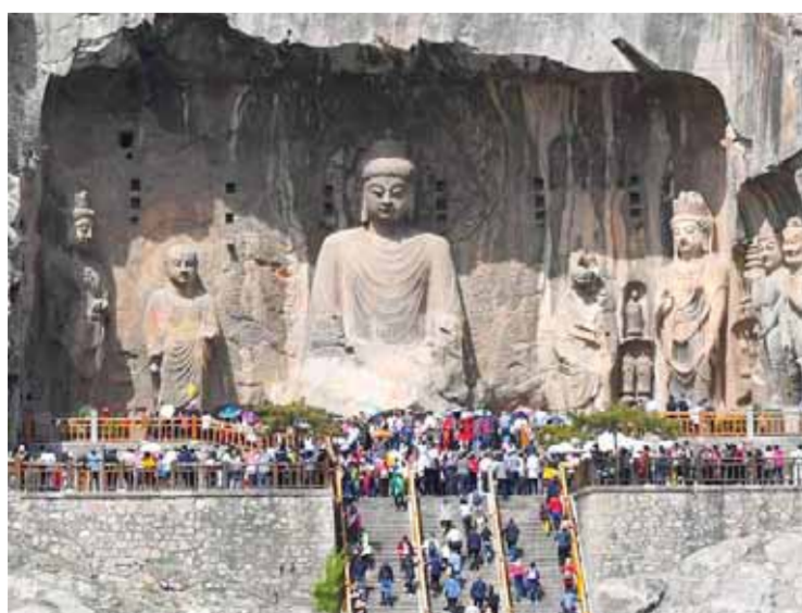
كهوف «لونغمن» الصخرية في مدينة لويانغ القديمة

يعرف باسم جيش الطين أو جيش التيراكوتا، كذلك يطلق عليه جيش الأرض المحيطة.