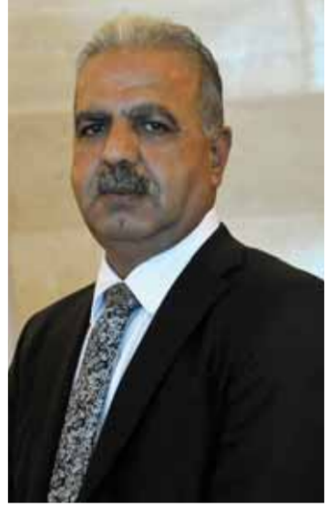
عبد الهادي شيبا

كشف وزير الكهرباء غسان الزامل لـ«الوطن» أنه نظراً لحدودية حوامل الطاقة وخاصة الغاز الذي تراجعت معدلات توريده خلال المرحلة الأخيرة سيتم التوسع في إدخال مجموعات التوليد العاملة على مادة الفئول التي يتم العمل على رفع معدل توريدها عبر بعض الاتفاقيات التي تسمح بزيادة كميات الفئول المتاحة، متوقعاً أن تدخل حتى نهاية الشهر الجاري (أيلول). وأوضح الزامل وجود ثلاث مجموعات أهمها في محطات توليد حلب وبانياس تعمل على مادة الفئول، مقدراً أن هذه المجموعات ستدخل أكثر من ٤٠٠ ميغاواط للشبكة بعد إدخالها في الخدمة وأنه على التوازي لذلك ستدخل عدة مشروعات للطاقة البديلة حيز الخدمة قبل نهاية العام الحالي منها نحو ١٠٠ ميغاواط عبر الطاقات الريحية ونحو ٥٠ ميغاواط من مشروعات الطاقة الشمسية في أكثر من موقع.