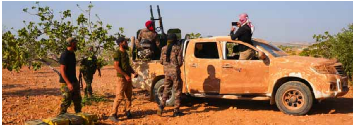
مقاتلون من العشائر العربية على خط المواجهة مع «قسد» على مشارف منبج (أ ف ب)

ولفت المصدر إلى أن وحدات الجيش كبدت الإرهابيين خسائر فادحة بالأفراد والعتاد، مشيراً إلى أن الجيش رد بتلك الاستهدافات على خروقات مجموعات إرهابية مما تسمى غرفة عمليات «الفتح المين» التي يقودها تنظيم «النصرة»، لاتفاق وقف إطلاق النار بمنطقة خفض التصعيد، واعتداءاتهم على نقاط عسكرية بقذائف صاروخية ورشقات رشاشة، في محور المشاريع المائية بسهل الغاب، وفي محاور ريف إدلب الجنوبي، وهو ما استدعى كثافة تارية بدك مواقعهم. وفي وقت متأخر أمس تحدثت مصادر إعلامية عن اشتباكات عنيفة جرت بين الجيش ومسلحي ما يسمى «أنصار التوحيد» على جبهة قرية ملاحة جنوب إدلب، وذلك بعد أيام من محاولة التنظيم الإرهابي الاستيلاء على القرية.