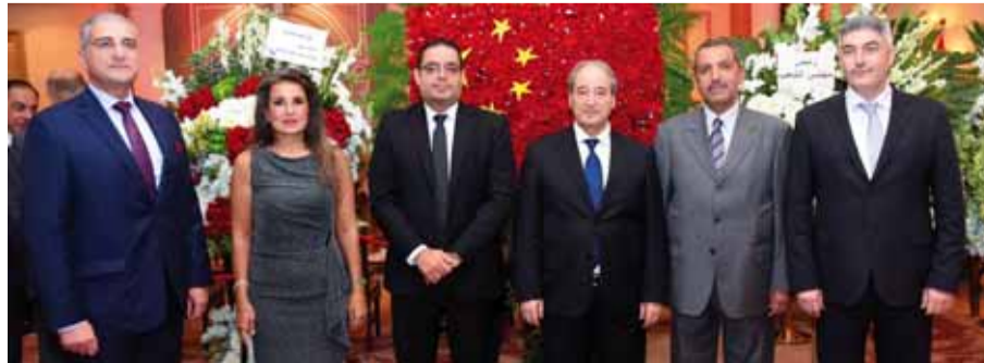
وزير الخارجية يتوسط عدداً من مديري إدارات وزارة الخارجية