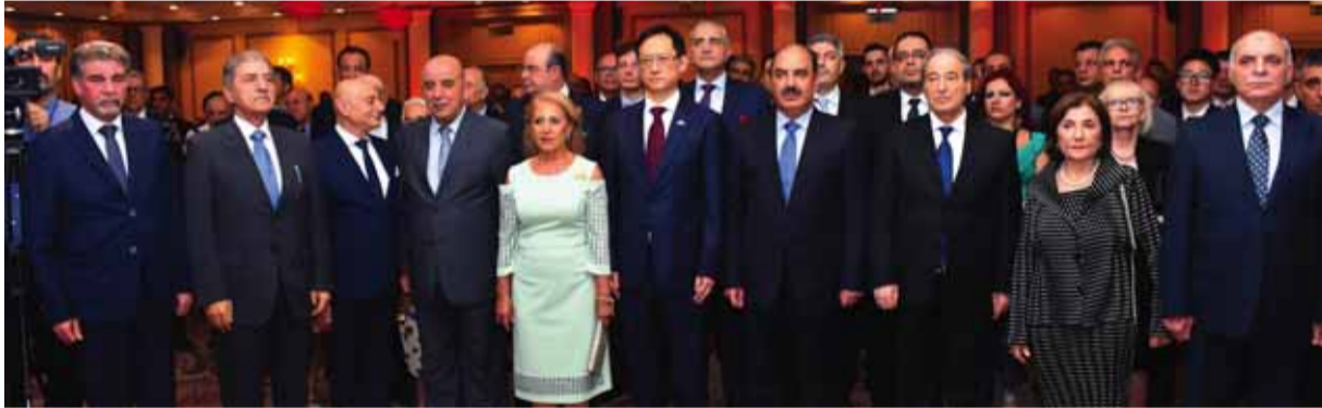
الحضور الرسمي للحفل الذي أقيم في فندق الداما روز بدمشق