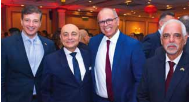
سفيرا كوبا والبرازيل والسفير عماد مصطفى وسفير فنزويلا