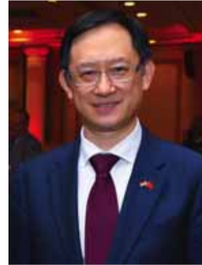
السفير الصيني شي هونغوي