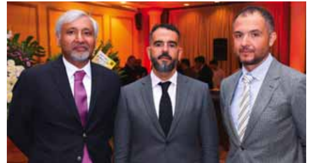
السفير الأرجنتيني يتوسط القائم بالأعمال الروماني والمستشار الباكستاني