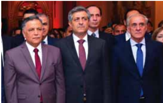
محافظ دمشق يتوسط وزير التربية ومعاون وزير الخارجية

أقامت السفارة الصينية في سورية حفل استقبال بمناسبة الذكرى الـ٧٤ لتأسيس جمهورية الصين الشعبية وذلك في فندق الداما روز بدمشق. وزير الخارجية والمغتربين فيصل المقداد أشار في كلمة له خلال الحفل إلى العلاقات التاريخية المتجذرة التي تربط البلدين لافتاً إلى وقوف الصين الدائم مع الشعب السوري مبيناً في الوقت ذاته أن العلاقات بين البلدين تتطور دائماً نحو الأمام، وقال: «هذه الفترة هي فترة القفز بالعلاقات السورية الصينية نحو خطوات جديدة». من جهته أشار سفير الصين في سورية شي هونغوي إلى أن الصين وسورية صديقان حميميان يتبادلان الثقة السياسية، ففي السنوات الأخيرة، وبفضل الرعاية المشتركة والقيادة الاستراتيجية من الرئيس شي جينبينغ والرئيس بشار الأسد، يواصل الجانبان تبادل الدعم الثابت في القضايا المتعلقة بالمصالح الجوهرية والهموم الكبرى للجانب الآخر، مؤكداً دعم الجانب الصيني بثبات للجهود السورية للحفاظ على استقلال البلاد وسيادتها وسلامة أراضيها. حضر الحفل إلى جانب وزير الخارجية والمغتربين الأمين العام المساعد لحزب البعث العربي الاشتراكي هلال الهلال والمستشارة الخاصة في رئاسة الجمهورية بفيثية شعبان ونائب رئيس مجلس الشعب أكرم العجلاني ووزراء الصحة حسن غباش والاتصالات إياد الخطيب والتربية محمد عامر مارديني والإعلام بطرس حلاق ونائب وزير الدفاع العماد محمود الشوا، ومعاون وزير الخارجية أيمن سوسان ومدير المعهد الدبلوماسي في وزارة الخارجية عماد مصطفى وعدد من مديري الإدارات في وزارة الخارجية وعدد من أعضاء مجلس الشعب والسفراء العرب والأجانب المعتمدين في دمشق ونخبة من رجال المال والأعمال والإعلاميين.