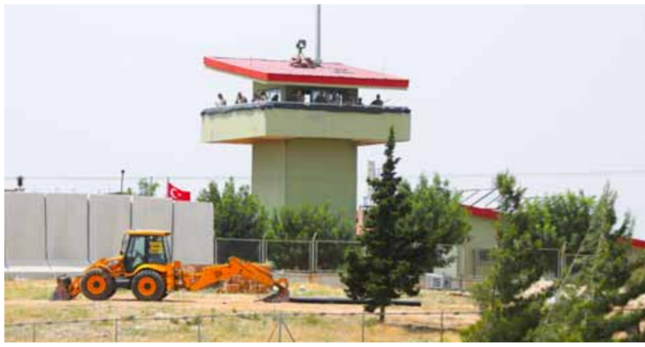
نقطة مراقبة لجيش الاحتلال التركي في محافظة ادلب

حماة - محمد أحمد خبازي دمشق - الوطن - وكالات