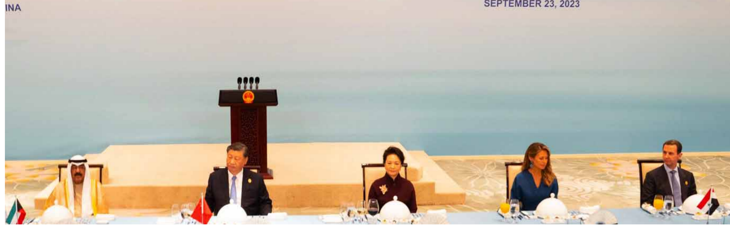
خانجو - الوطن

أكد الرئيس الصيني شي جين بينغ أن دورة الألعاب الآسيوية التاسعة عشرة تحمل تطلعات الشعوب الآسيوية إلى السلام والتضامن.