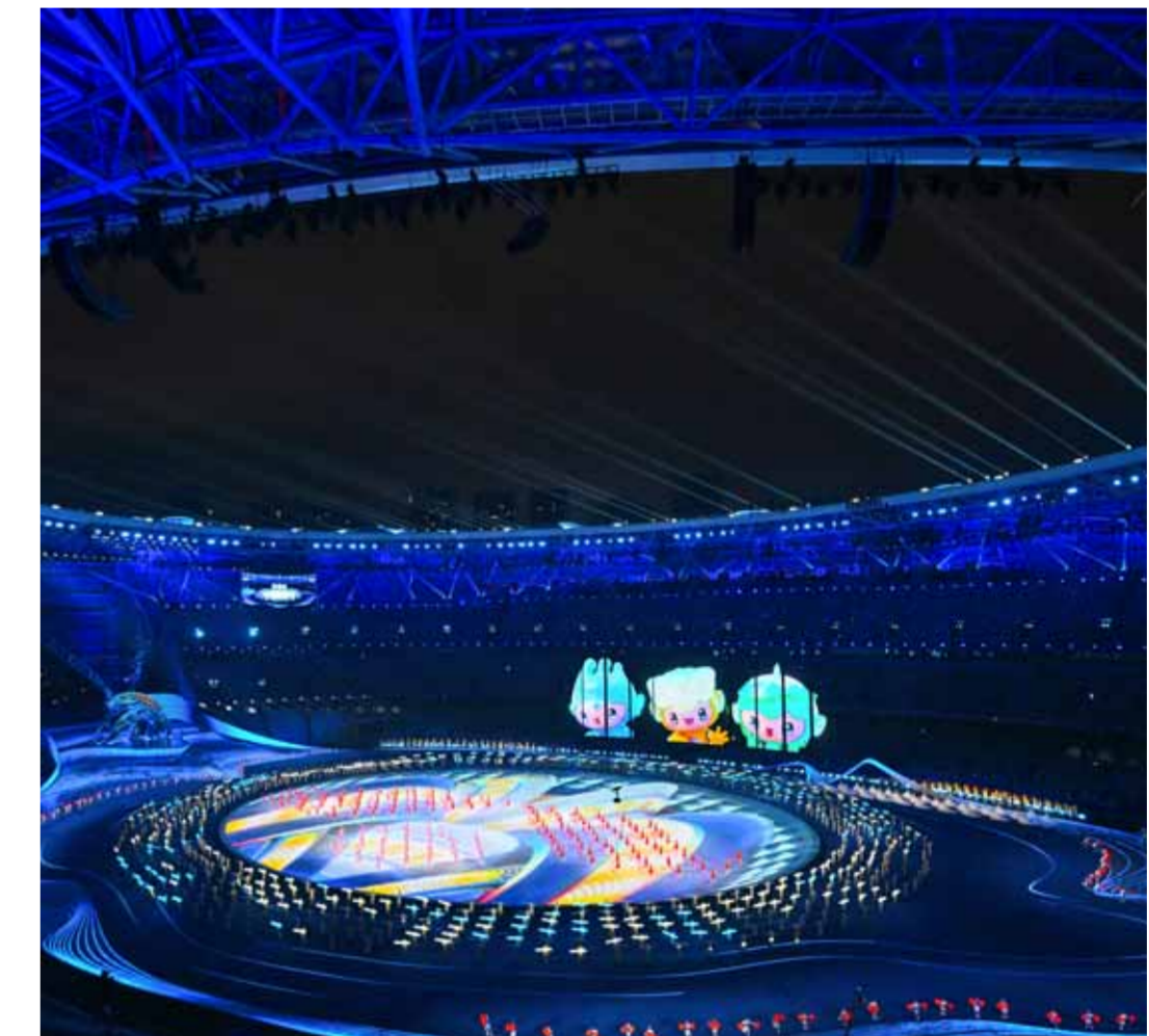
خانجو - الوطن - وكالات

الأولمبي الآسيوي راجا راندير سينغ بجهد اللجنة المنظمة لدورة الألعاب الآسيوية، من خلال استعدادها للمهرجان الرياضي القاري. وقال سينغ: «لقد قمتم بعمل رائع في التحضير لدورة الألعاب الآسيوية. كان التأجيل لمدة عام بسبب جائحة كورونا إلا أن اجتهادكم وتصميمكم سيؤدي ثماره على مدار الأيام الـ١٦ القادمة، وستتفوقون المكافأة الأكبر بتحقيق دورة الألعاب الآسيوية الأكثر جمالا ونجاحا على الإطلاق».