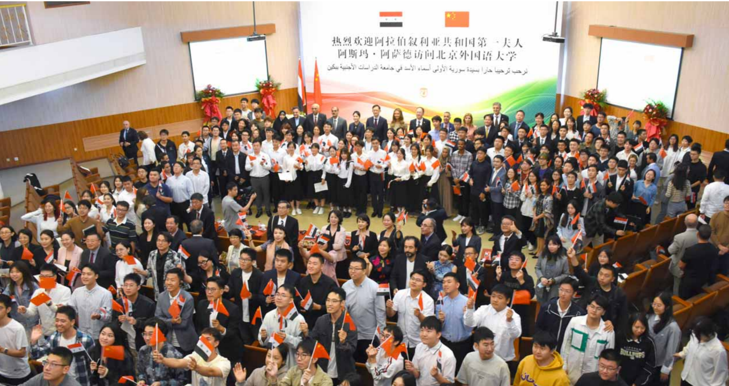
بكين - سوريات

لمستوى الشراكة، لافتاً إلى المحبة التي يكتها الشعب الصيني للشعب السوري، ولدى مجموعة من الطلاب عدداً من اللغات الشعرية ومنها القصيدة العذبات مع سورية وتجربتها عبر التاريخ والمحبة التي يكتها الشعب الصيني تجاه السوريين وتجاه ضيقتهم الكثير، احتلت جامعة الدراسات الأجنبية في بكين بالسيدة الأولى أسماء الأسد التي حضرت لإجراء حوار مع طلبة.