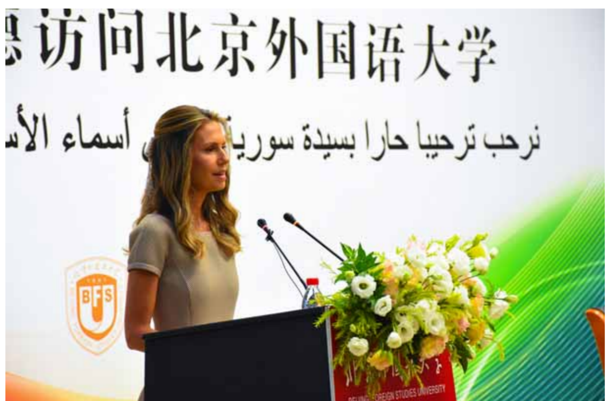
ترحب ترحيباً حاراً بسيدة سوريات أسماء الأسد

الدعوة للفخر باللغة الأم والتمسك بالتراث الثقافي الوطني لا يعني دعوة انعزالية اللغة طريق ربط قديماً بين حضارتنا وبتجه اليوم نحو مستقبل أبنائنا