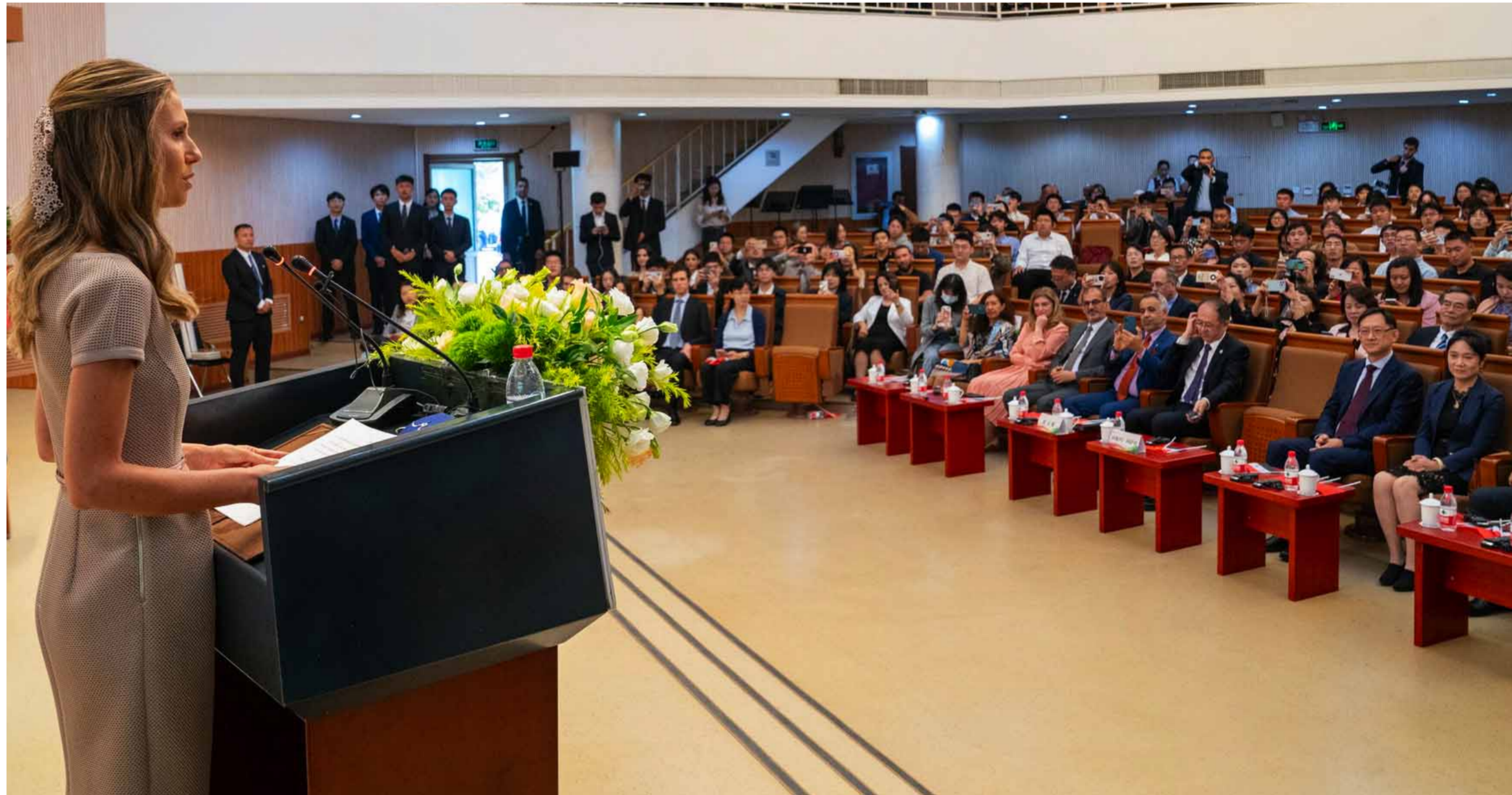
بكين - الوطن

أكدت السيدة الأولى أسماء الأسد في مستهل لقاء حوارى مع طلاب الدراسات العربية في جامعة الدراسات الأجنبية في بكين، حول اللغة والعلاقات الإنسانية والثقافية بين الدول، أننا جميعاً نواجه نفس محاولات طمس الثقافات الوطنية للشعوب، عبر وسائل متعددة في الشكل، واحدة في المضمون. عنوانها: احتلال الوعي. فاحتلال اللغة هو السبيل الأقصر إلى احتلال الوعي، وبالتالي احتلال القرار المستقل، وتهميت المجتمعات ومحو هويتها وتجزئتها، وما على أن الدول العربية المتسكة بتاريخها الحضارى والإنسانى، الفخورة بهويتها ولغتها، أن ترفض مفاهيم شاذة ومرفوضة عن صورة الأسرة تزال مطمئة للمستعمرين منذ آلاف السنين وحتى اليوم، وموحدة الحاضر ومستقبلنا.