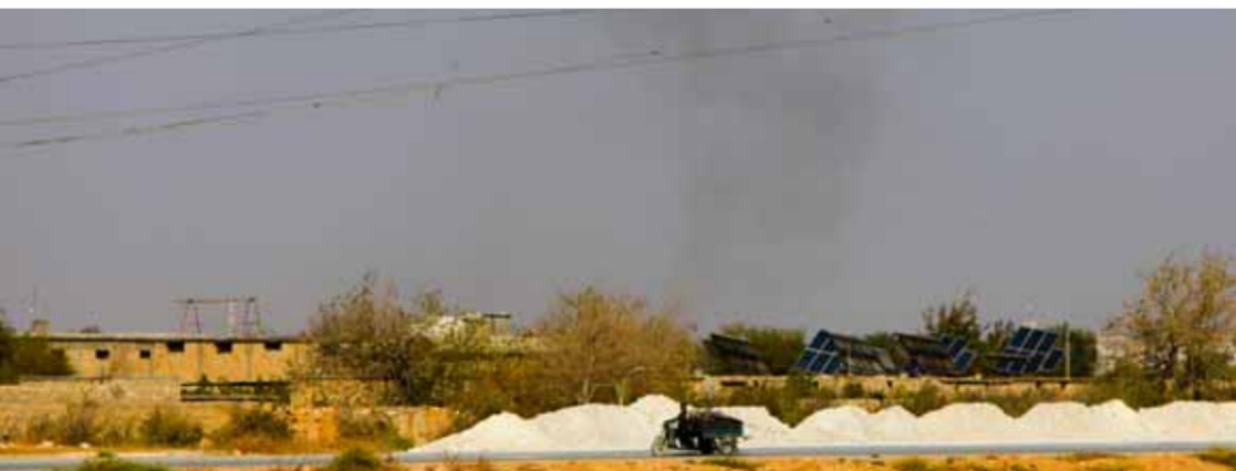
معارك متواصلة بين الإرهابيين المدعومين من الاحتلال التركي و«هيئة تحرير الشام» للسيطرة على معبر الحمران شمالاً في محافظة حلب

معبر «الحمران» الذي يربط بين شمال شرق حلب ومناطق سيطرة «قسد»، وتزامنت التعزيزات مع استنفار عسكري كبير لفصائل «الجيش الوطني» في منطقة احتمالات وأخترين شمال حلب، إضافة إلى قطع العديد من الطرقات وسط حالة من الفوضى التي تشهدها المنطقة. في المقابل شن مقاتلو العشائر العربية هجمات منسقة ضد مواقع ميليشيات «قسد» في ريف دير الزور الشرقي رغم الدوريات التابعة لما يسمى «التحالف الدولي» المساندة للميليشيات، وكيدتهم خساتر بشرية في مواقع عدة بالريفين الشرقي والشامي.