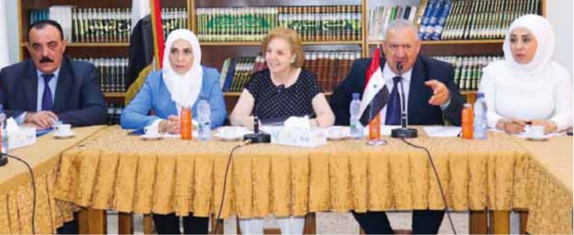
الوطن | مشروع وطني