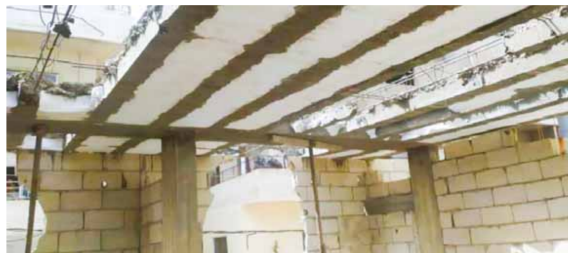
معاينة الفاسدين والمقصرين والمرتكبين والمخالفين، وفقاً للقانون. مصادر أكدت أن هذه الخطوة هي لبنة في إعادة الإعمار ومحاربة الفساد، والتأكيد على ثقة المواطن بالجهات الرقابية وقدرتها على مكافحة الفساد في سياق متصل أكدت مصادر مطلعة: ومعاينة المرتكبين والمقصرين والمخالفين بشكل عام.

اللاذقية - عبير محمود علمت «الوطن» من مصادر خاصة أنه تم توقيف مسؤولين سابقين وحاليين لا يزالون على رأس عملهم ومخاتير أحياء ومتعهدين وأصحاب نفوذ وذلك للتحقيق في ملفات فساد وتقصير وارتكاب مخالفات بمجالات مختلفة على مستوى محافظة اللاذقية. المصادر كشفت أن ملفات الفساد تشمل مخالفات بخصوص البناء والتعهدات وهدر أموال عامة ومجالات أخرى سيتم كشفها لاحقاً، وتم على إثرها توقيف عدد من المسؤولين وأصحاب النفوذ والمتعهدين، وإصدار قرارات منع مغادرة ووضع إشارات حجز احتياطي على أموال عدد منهم ربما تسر نتائج التحقيق الذي لا يزال جارياً في الفترة الحالية. وتشير المعلومات إلى أن التحقيق مستمر ومتابع بشكل جدي للحد من الفساد