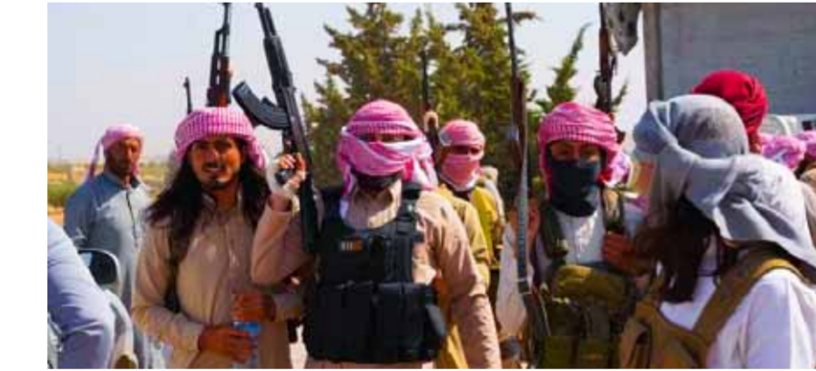
قوات من العشرات العربية في ريف دير الزور الشرقي