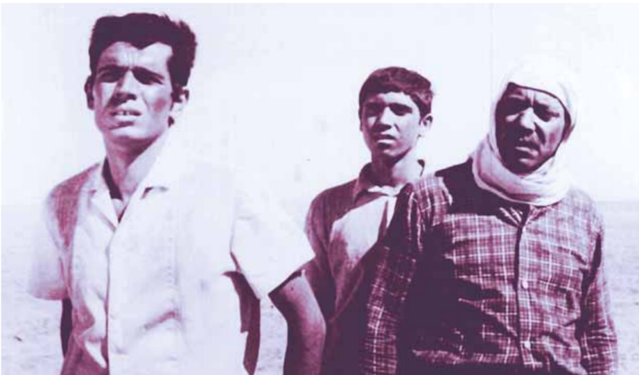
من فيلم «المخدوعون»