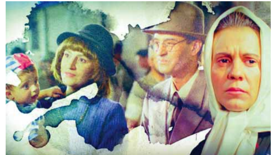
من فيلم «التقيي»

أحداثه حول معاناة أرباب الأسر بعد نكبة ١٩٤٨ فبعد أن كان الرجل الشجاع المقدم الذي يتمتع بشجاعة وبسالة منقطعة النظير، بات شخصاً عاجزاً لا حول له ولا قوة.