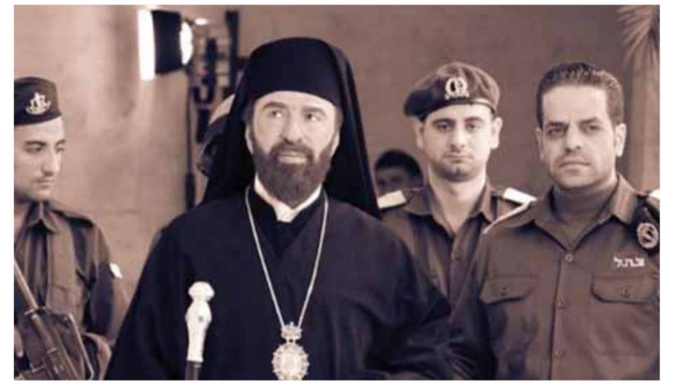
من مسلسل «حارس القدس»