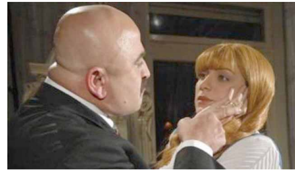
من مسلسل «رسائل الحب والحرب»

على ما تخلفه الأحداث والحروب والأحداث المريرة على الصعيد الإنساني، فبهرن العمل على ضرورة العدل والاستمرار في مسألة السلام والحب. فصور العمل حوادث حصار مدينتي رام الله وجنين، وركز على أهمية التلاحم الديني في كثير من مشاهد ولعل أبرزها صلاة المسلمين في كنيسة المهدي، إضافة إلى أنه قدم صوراً عديدة للإنسان العربي المتضامن والمتسامح الساعي للخير. وقد أدى أنوار البطولة في العمل عدد من نجوم العرب ومنهم عباس النوري وحسن عويتي وديمة قندلفت والأرمنيون منظر رياحته وصيا مبارك وإياد نصار وأخرجه التونسي شوقي الماجري.