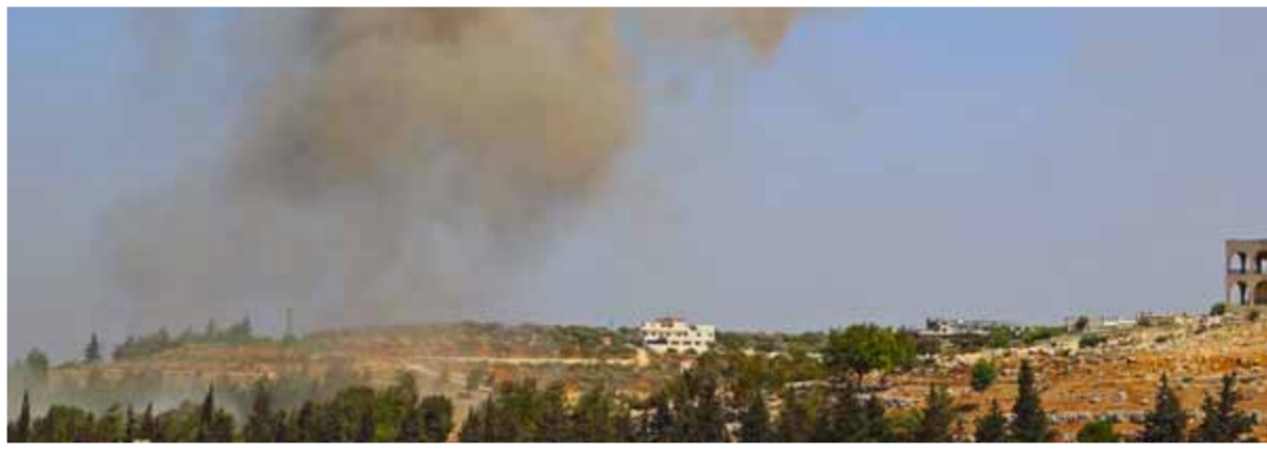
الجيش العربي السوري يستهدف مقرات الإرهابيين في ريف إدلب (عن الإنترنت)

مواصلة وحدات الجيش استهدافها إرهابيي الشمال تزامناً مع تواصل الاشتباكات بين قوات العشرات العربية ومليشيات «قوات سورية الديمقراطية- قسد» في أرياف دير الزور، وتركت أمس في مدينة الشحيل ريف