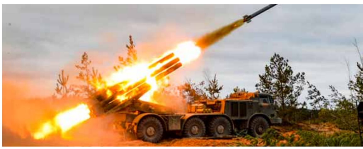
الجيش العربي السوري يستهدف مواقع تنظيم «جبهة النصرة» الإرهابي في منطقة «خضف التصعيد»

وصرحت المصادر لـ«الوطن»: أن مقاتلي العشرات نصبوا ليلية الأريعاء كميناً مسلحاً محكماً لأحد متزعمي «قسد»، ويلقب بـ«كمان»، وذلك على الطريق العام الواصل إلى مدينة الشحيل بريف دير الزور الشرقي، وأعقب الكمين اشتباكات قوية بالأسلحة الرماشة خاضها مقاتلو العشرات لأكثر من نصف ساعة قتلوا وجرحوا ما يزيد على ٧ مسلحين من الميليشيات، من دون معرفة مصير متزعمهم، الذي يتوقع أن يكون أصيب بجروح. إن ذلك دعا الهلج في تسجيل صوتي أمس أبناء العشرات العربية إلى تجميع الصراخ ضد «قسد» والموالين لها، بغية إنهاء وجودها في المناطق التي يشكل المكون العربي أغلبية سكانها، كما دعا أبناء القبائل العربية في الرقة ودير الزور إلى الانشقاق عنها. وأعلن عن تشكيل «قيادة عسكرية عشائرية» تتبع لجيش القبائل والعشرات العربية.