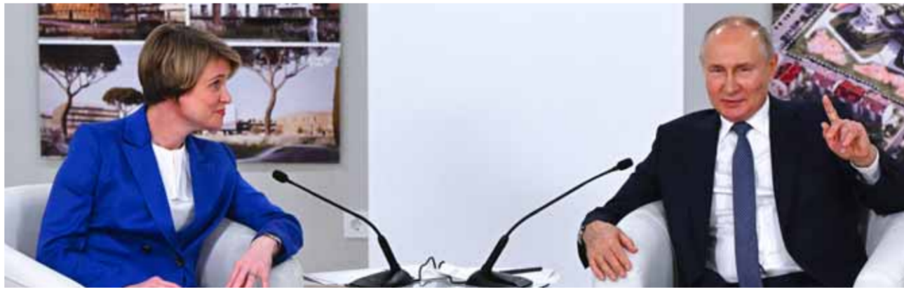
الرئيس الروسي فلاديمير بوتين خلال الجلسة العامة لأولياء المدارس الدولي للأمم في مركز «سيريبوس» التعليمي للموهوبين (أ ف ب)

وإضافة: ستقدم الدعم من أجل الوصول إلى الريادة الاستراتيجية وإعداد الكوادر في مجال الرياضيات والبرمجة، مشيراً إلى أنه لا يمكن للكفاء الاصطناعي أن يتجاوز الإنسان في مجال الرياضيات وبرمجة الحاسوب. وحول رغبة الدول الغربية في مواصلة السياسة الاقتصادية الاستعمارية، قال بوتين: «قيلون سيجبون مثل هذا المستقبل»، العالم يتخلص من النموذج الذي يدفع مناطق ياكلها إلى العبودية والقروض، لافتاً في الوقت ذاته إلى أن ضمان الأمن المالي أصبح صعباً على نحو متزايد ويتطلب مستوى عالياً من التخصصين والخبراء. وأكد أن تطوير أنظمة التعاملات الجديدة بين الدول يصب في مصلحة العالم متعدد الأقطاب، وأن تأهيل الكوادر في مجال الأمن المالي وتوسيع حوصل بلاده على الوضع النووي.