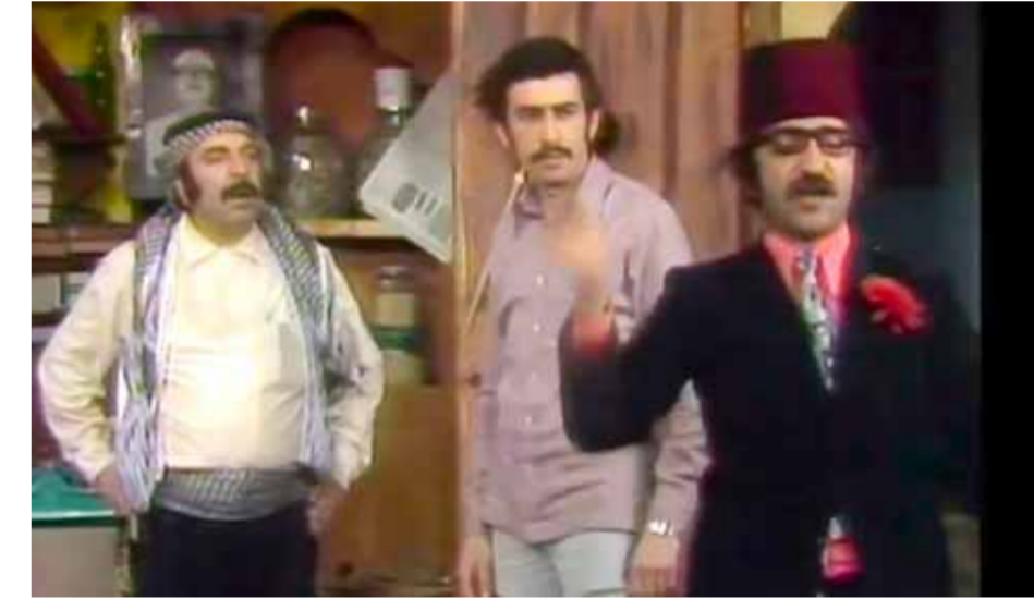
من مسرحية «ضبعة تشرين»