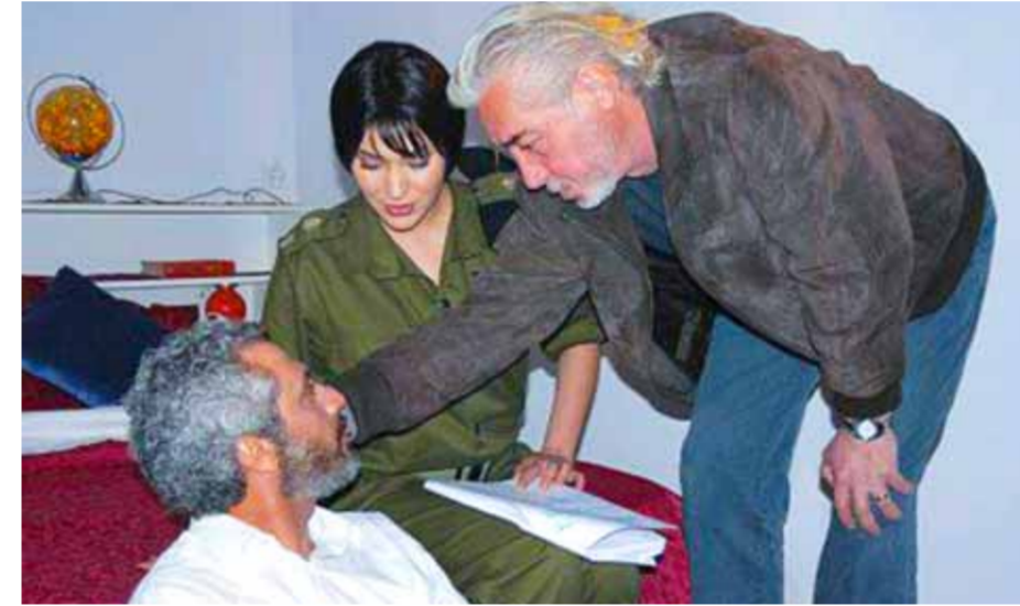
المخرج نجدة أنزور أثناء إنجاز مسلسل «رجال الحسم»

«ألف جبل مشنقة ولا يقولوا بوعمر خاين يا خديجة» أصبحت أيقونة درامية ما زالت تردّد حتى الآن