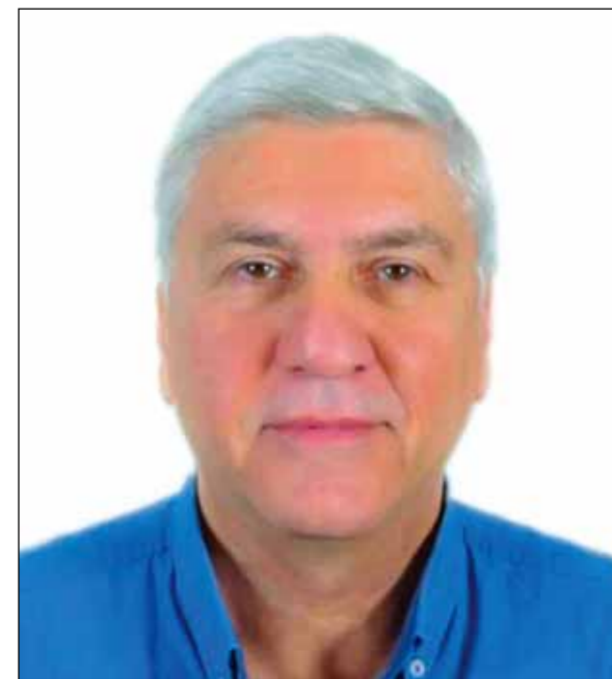
إقالتي بعد صدور قرار من الاتحاد والمكتب التنفيذي.

لم يكن أشد المتشائمين بعمل اتحاد كرة السلة يتوقع أن يخسر أحد أهم أعضائه البارزين من حيث التاريخ والعراقة والخبرة الفنية بهذه الطريقة التي لا تمت للاعتراف العملية الأمر الذي ترك الكثير من إشارات الاستهجان حيال قرار إقالته الذي جاء تحت حجة أسفاره الكثيرة، وكان عمل اتحاد السلة بحاجة لتفرض كامل، وكان اجتماعاته الدورية لم تنقطع على مدار الشهر والسنة، ومنتخباته الوطنية تتحضر وتستعد على مدار العام، ومسابقاته لا تكل ولا تهدأ.