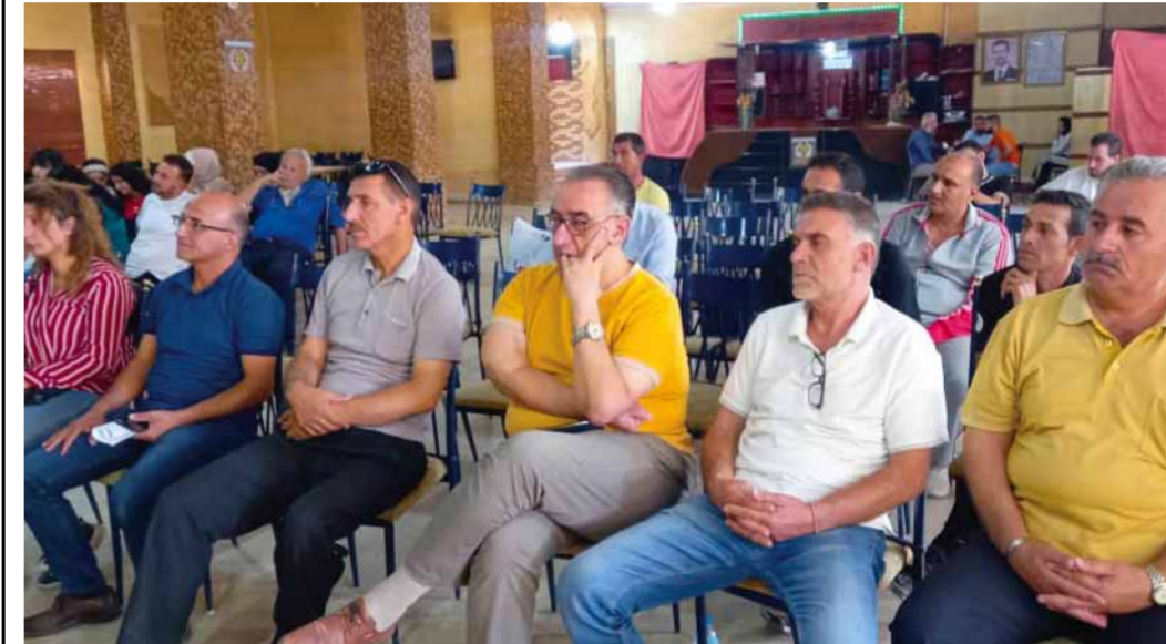
الحسكة - دحام السلطان

هموم وآلام وأمات وأثارت عرضها مؤتمر نادي الجزيرة الإعلامي الأسبوعي الفائت وحضره المعتنقون من الكوادر الرياضية المعنية أيضاً بمعظم ألعاب الواجهة المقيدة على سجلات وكشوفات النادي، حيث شرحت الدعوة التي وجهتها إدارة النادي الجديدة وبحضور اللجنة التنفيذية لفرع الاتحاد الرياضي بالحسكة، الواقع الذي هي عليه وكما هو ولم تغفل على كوادرها الرياضية والإعلامية أي نقطة، وإن كان حضورها مقتضباً، بل شرحت ويشكل مفصل كتلة المهوم على طاولة الوجد وغصاته المزممة التي يعيشها النادي، في مختلف وجمع الجوانب الإدارية والتنظيمية والمالية والفنية والإنشائية منذ أن جاءت إلى العمل في الإدارة؟