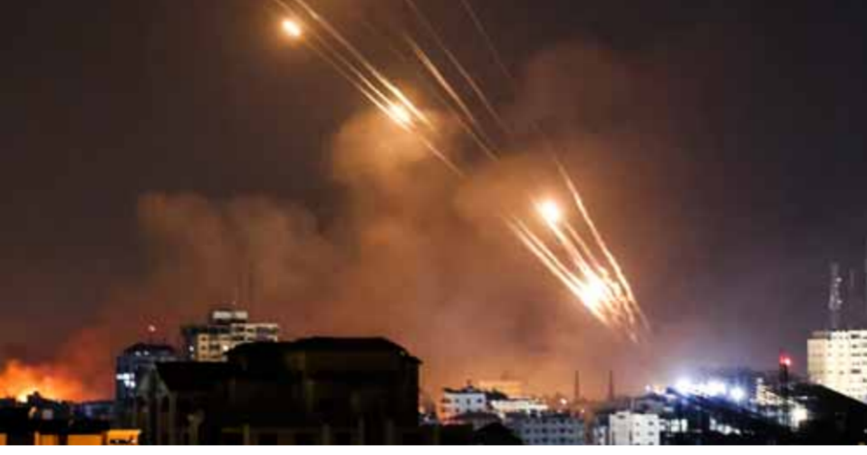
مسلحون فلسطينيون يطلقون وبأبلا من الصواريخ من مدينة غزة باتجاه كيان الاحتلال (أ ف ب)

من جهتها قالت كتائب «الشهيد عز الدين القسام» الجناح العسكري لحركة «حماس» في بلاغ عسكري حمل الرقم ٣ نشره الإعلام الحربي في المقاومة الإسلامية في قناته على تلغرام: «مازال مجاهدو كتائب القسام يخوضون اشتباكات ضارية في عدة مواقع قتال داخل أراضينا المحتلة منها: (مستوطنات) أوفاكيم وسديروت وياد مرخاي وكفار عزة وبثري وبيند وكسوفيم، وتقوم مفاز المدفعية بإسناد المقاتلين بالقذائف الصاروخية»، في حين نقل «الإعلام الحربي في المقاومة الإسلامية» عن المراسل العسكري لـ«سرايا القدس» الجناح العسكري لحركة «الجهد الإسلامي» قوله: «مازال مجاهدونا الأبطال من قوات النخبة يخوضون اشتباكات عنيفة في مواقع العدو