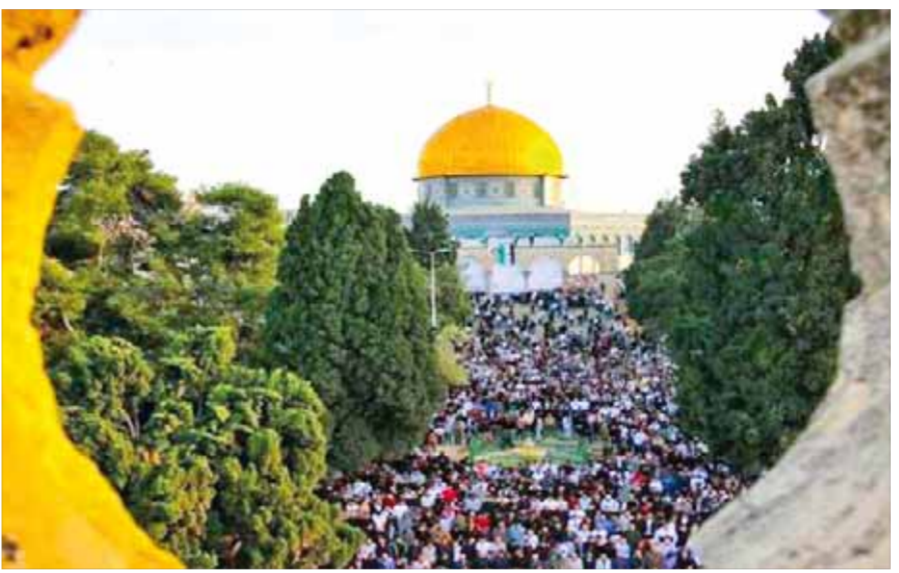
من نبوءة الشاعر الكبير نزار قباني في قصيدته، منشورات هدايئة على جدران إسرائيل، قبل ٦٠ عاماً.